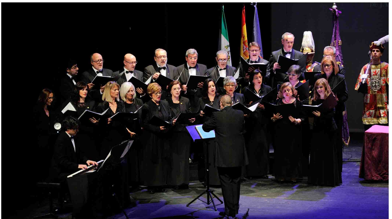
La Cantoría de Jaén interpreta el Himno de Enfermería.