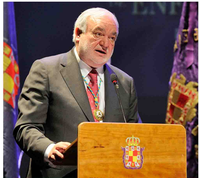
Discurso del presidente del Colegio.