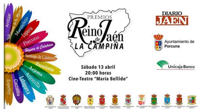
Imagen promocional del evento.