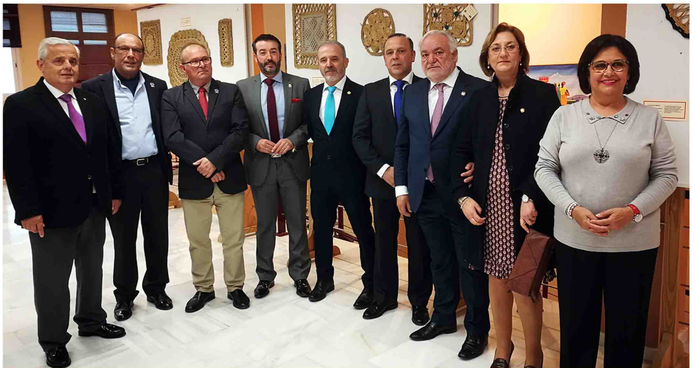
Autoridades y miembros de la Junta de Gobierno del Colegio.