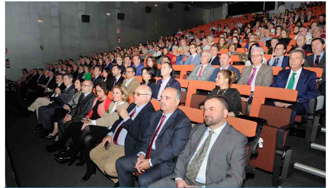
Asistentes al acto.