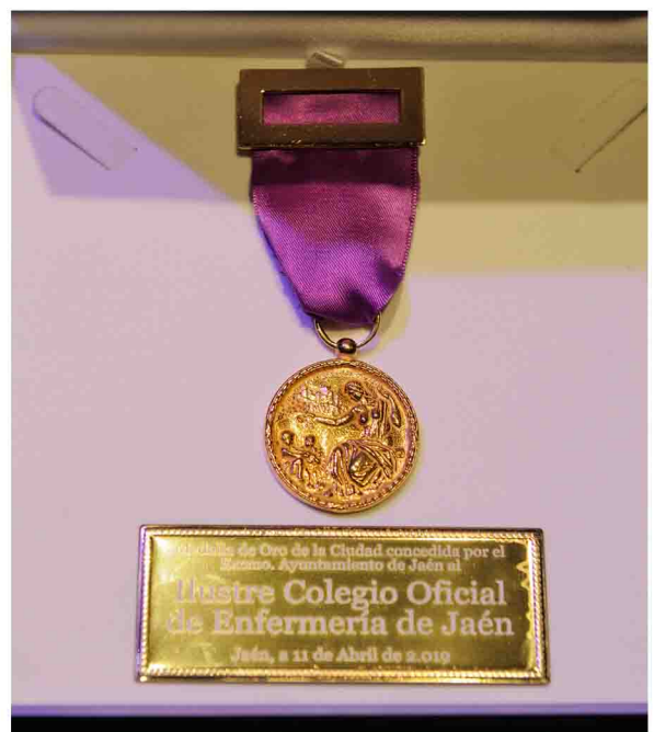
Primer plano de la Medalla de Oro de la Ciudad de Jaén.

Durante su intervención, el presidente del Colegio hizo un sentido alegato a la profesión enfermera. "Nuestro trabajo no se entiende si no es desde la vocación y el servicio al prójimo", expuso. "En algún momento de nuestra vida, en situaciones muy dispares, desde los momentos de suma felicidad, como es el nacimiento de un hijo o en aquellos que encierran