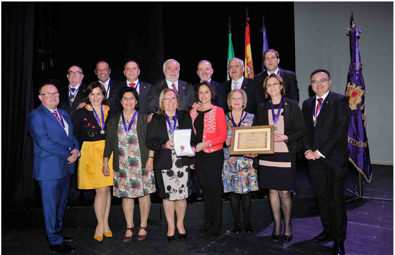
Autoridades y miembros de la Junta de Gobierno con la Medalla de Oro de la Ciudad de Jaén.