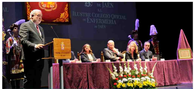
Discurso del presidente del Colegio.