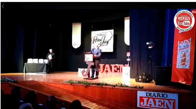
El presidente del Colegio de Enfermería de Jaén durante su discurso.