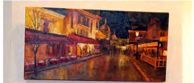
Obra ganadora del accésit: “París”.