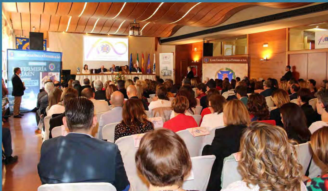
Panorámica del salón, en la Casería de Las Palmeras.

En el acto se ha reconocido la labor de los profesionales jubilados, de los integrantes de la XIV promoción de Enfermería en su 25 aniversario y se han entregado los premios de los certámenes nacionales de Investigación, Pintura y Fotografía