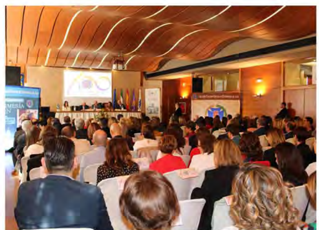
El salón presentaba un lleno absoluto.