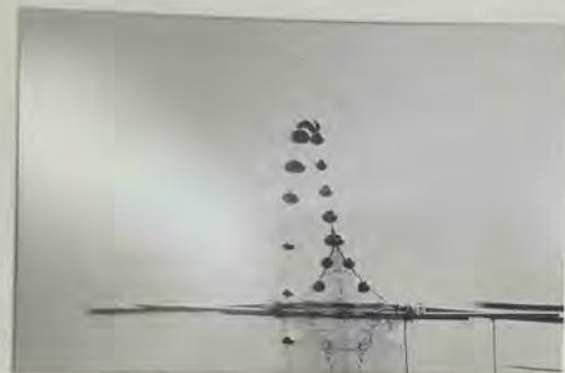
“Red” se hizo con el accésit.