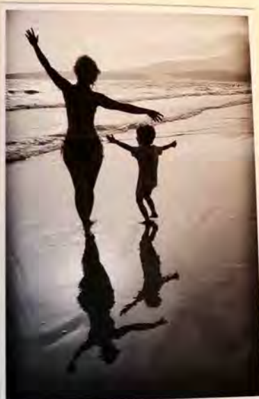
El primer Premio recayó en la obra “Dobles Parejas”.