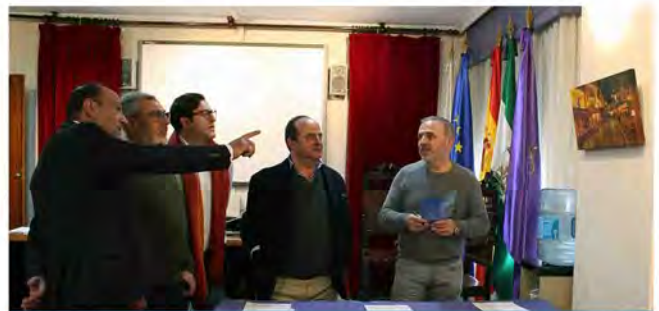
Reunión del jurado para deliberar.