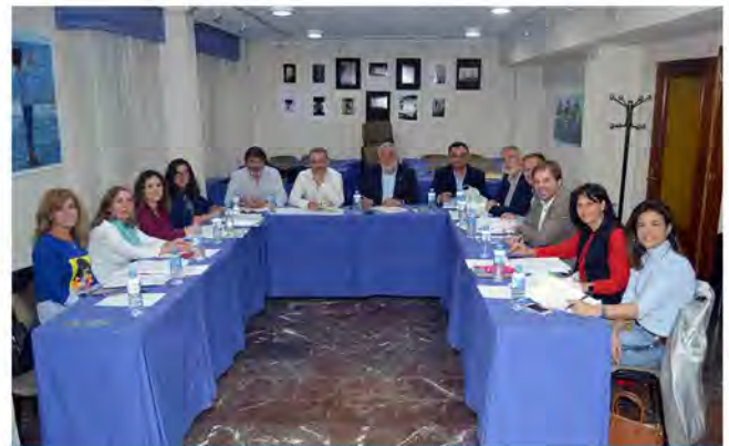
Reunión del jurado para deliberar.