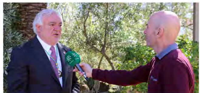
El presidente del Colegio en una entrevista con Canal Sur TV.