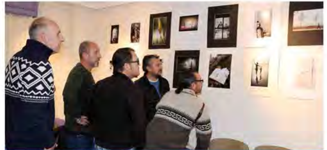
Miembros del jurado observan las fotografías.