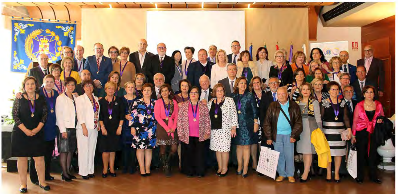
Imagen de grupo de los compañeros jubilados en el último año y a los que se rindió homenaje en el marco de la celebración del Patrón, San Juan de Dios.