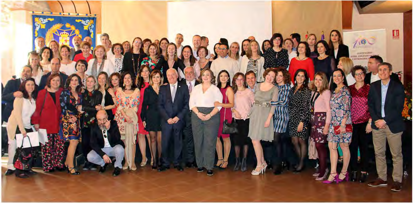
Foto de grupo de los integrantes de la XIV promoción de Enfermería a los que se rindió homenaje en el marco de la celebración del Patrón, San Juan de Dios.