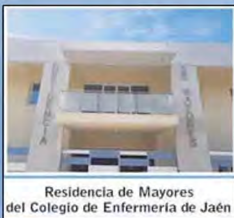
Residencia de Mayores del Colegio de Enfermería de Jaén

Ilustre Colegio Oficial de Enfermería de Jaén