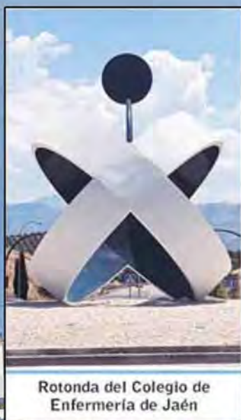
Rotonda del Colegio de Enfermería de Jaén