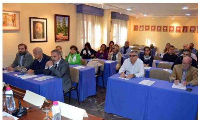
Compañeros asistentes a la jornada.

Por último, se entabló un interesante debate sobre la situación de las especialidades y la necesidad de crear más plazas y de que éstas sean cubiertas por la misma especialidad.