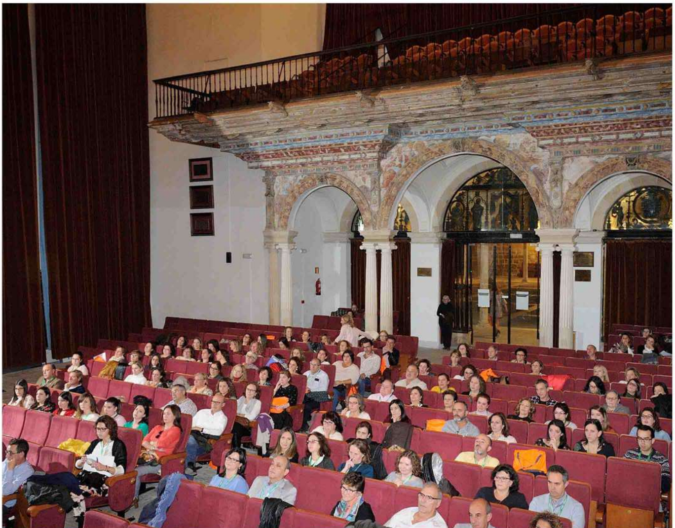
Panorámica del Auditorio.

También se habló de la configuración de la profesión enfermera en la provincia de Jaén, con unas pinceladas de historia o de la implementación de heridas crónicas en el domicilio del paciente; musicoterapia en hipertensión arterial y educación sexual y reproductiva a través de los valores en los adolescentes, entre otros asuntos.