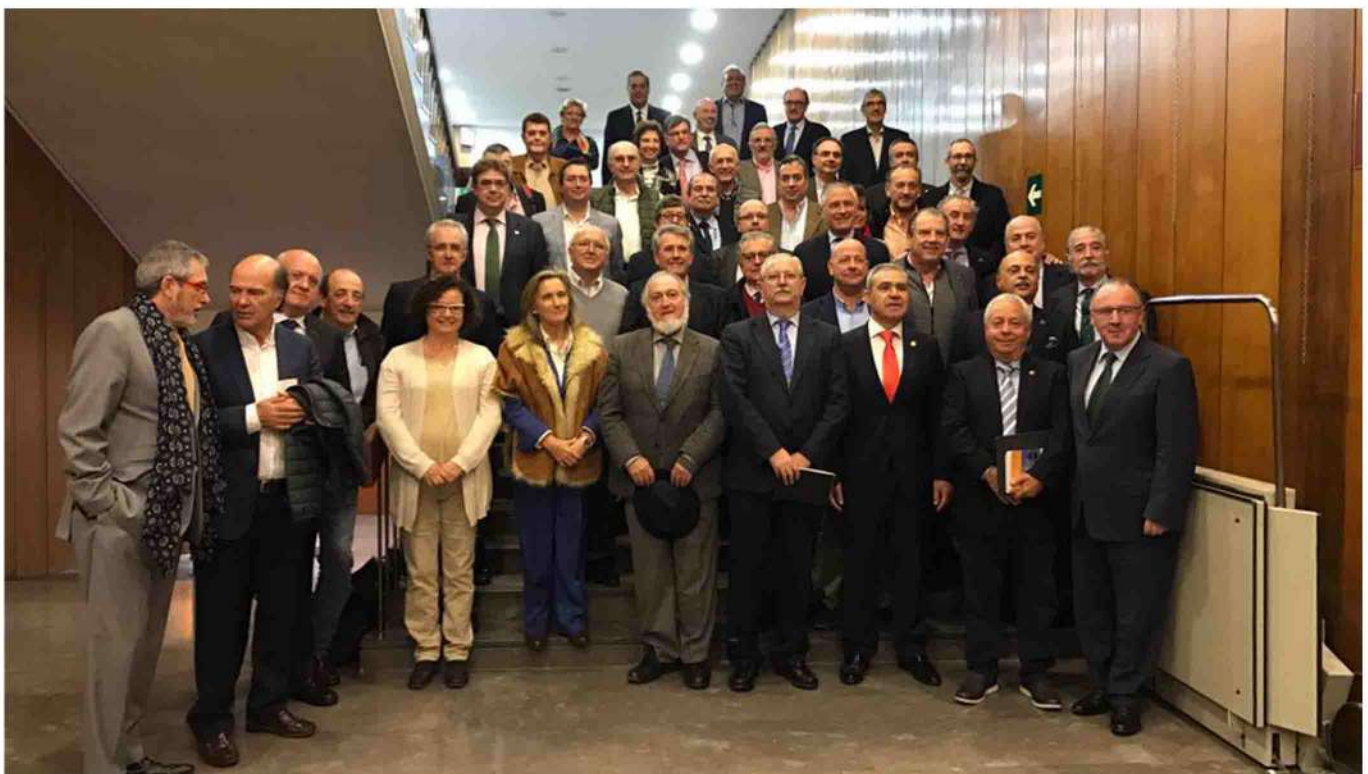
Foto de grupo de los miembros de la Asamblea.