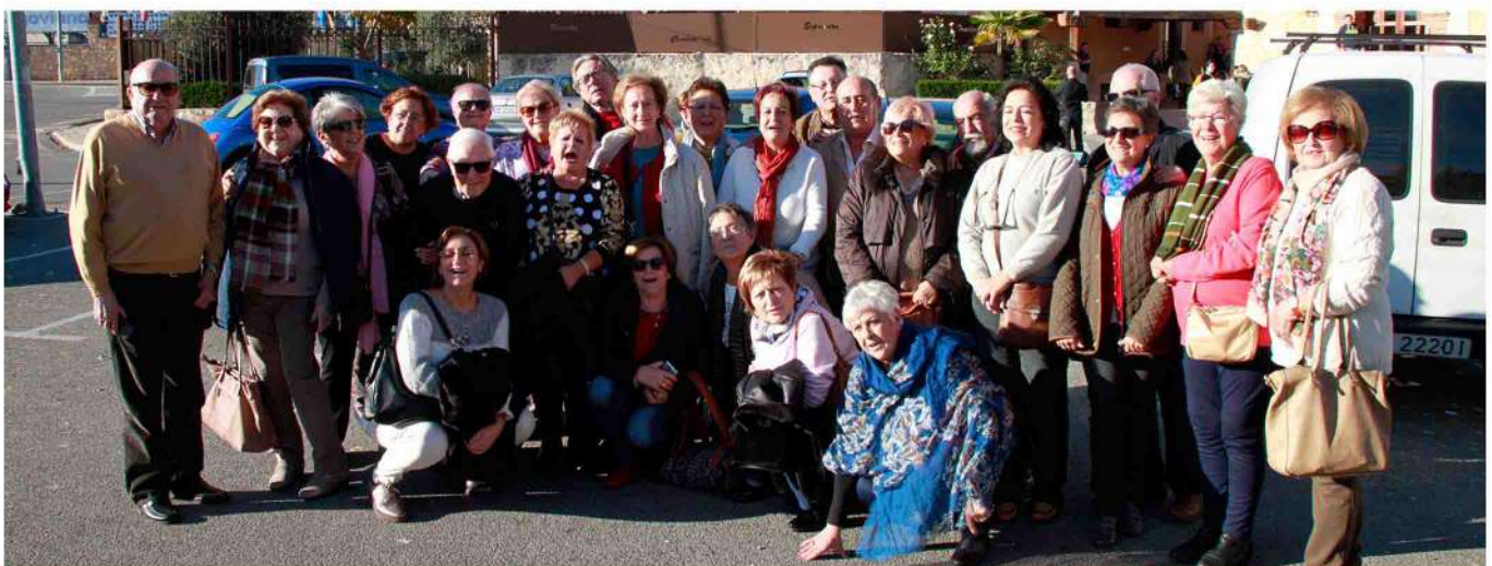
Grupo de jubilados en Segovia.