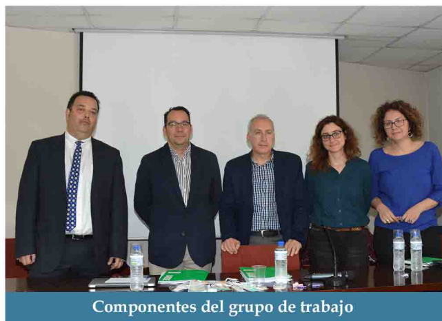
Componentes del grupo de trabajo

Los datos obtenidos se incorporarán a una novedosa herramienta informática y, una vez analizados todos, la Mesa de la Profesión Enfermera elaborará el 'Informe