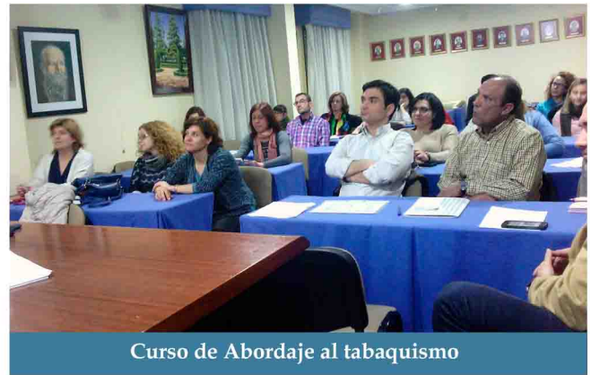
Curso de Abordaje al tabaquismo