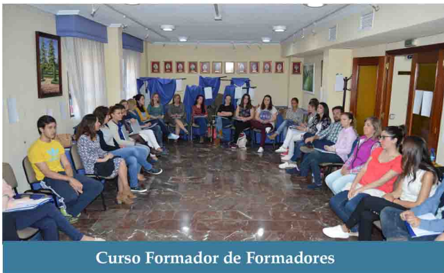
Curso Formador de Formadores