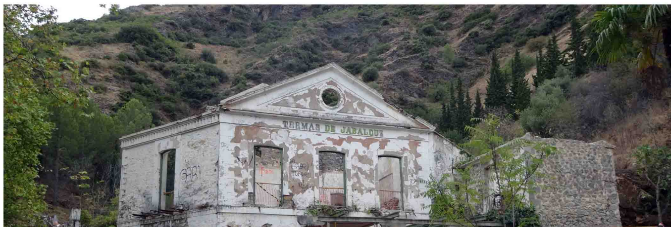
Imagen actual de las Termas de Jabalruz