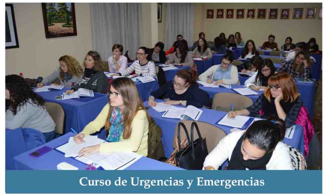
Curso de Urgencias y Emergencias