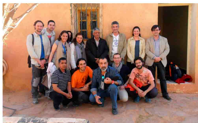
Desarrollo de trabajos en un campamento saharauí

Mandadnos información a: colegio@nfermeriajaen.com .