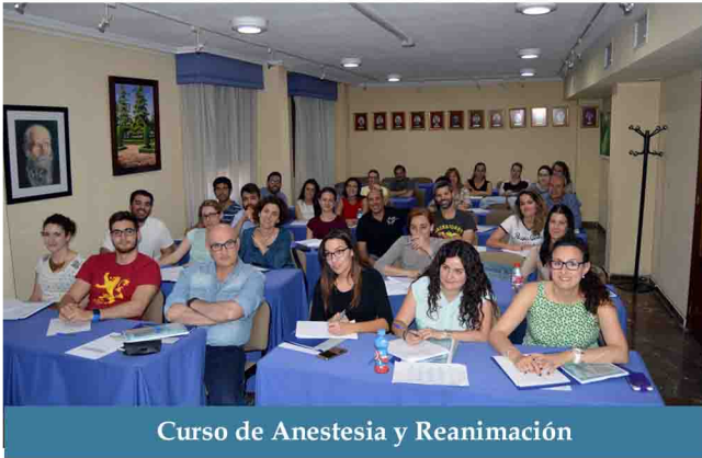
Curso de Anestesia y Reanimación