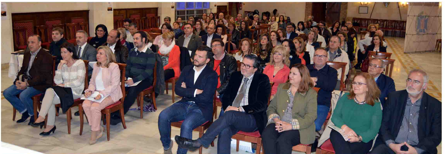
Asistentes al Día Internacional de la Enfermera

personal sanitario que ofrezca buenos resultados. “En otras palabras, no se puede lograr que la población esté sana sin invertir en la fuerza laboral sanitaria”, ha informado Lendínez. Como destaca el Consejo Internacional de Enfermeras (CIE), precursores de este día, cada vez hay más evidencia de que, además del beneficio económico de mantener a las personas sanas, las inversiones en personal de salud pueden tener repercusiones positivas en el desarrollo socioeconómico. “Tenemos que transformar la forma tradicional de considerar el personal de salud como un coste o gasto para pasar a considerar la inversión en él como una estrategia para lograr la salud para todos”, han informado.