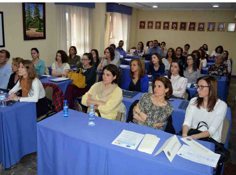
Compañeras que asistieron al acto