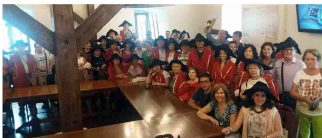
En la imagen de abajo a la izquierda: Foto de grupo; en las otras dos, miembros del grupo posan ante los monumentos visitados.

Un grupo de enfermeras y enfermeros han viajado a Rumanía, en un viaje organizado por el Colegio de Enfermería de Jaén y la agencia Viajes Barceló. Durante unos días, el grupo ha descansado y ha podido disfrutar de unas merecidas vacaciones en un país de gran riqueza patrimonial, natural y gastronómica. Algunos de los lugares que han visitado han sido Bucarest, Curtea de Arges, ex capital de Valaquia, Sibiu, región de Moldavia, comarca de Bucovina o Brasov, entre otros.