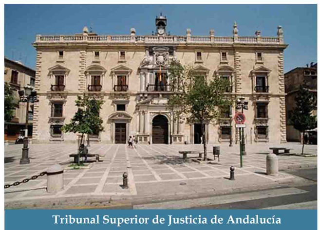
Tribunal Superior de Justicia de Andalucía