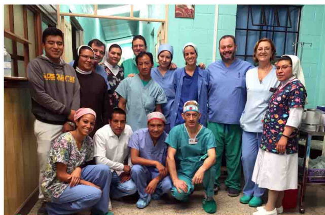
Enfermeros durante su viaje solidario

Algunos de nuestros compañeros han viajado en las últimas semanas hasta Guatemala y Nicaragua, de la mano de Quesada Solidaria, para ofrecer lo mejor de nuestra profesión y de sí mismos en pos de los demás. La asistencia sanitaria a poblaciones desfavorecidas es en lo que han destinada la mayor parte de su tiempo. Solidaridad en estado puro.