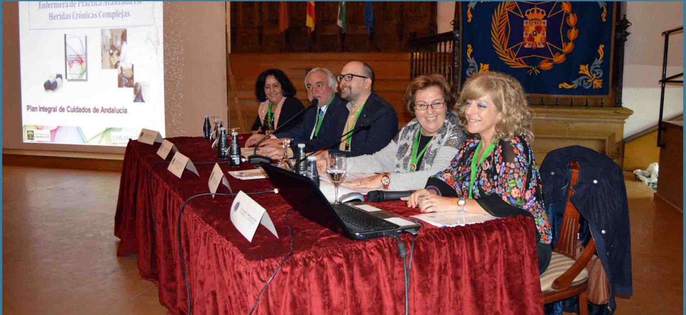
Una de las mesas redondas constituidas en la pasada edición de #EnferJaén

Una cita ineludible para la Enfermería de la provincia. La IV Jornada provincial #enferjaen, organizada por el Colegio de Enfermería de Jaén, se celebra el jueves, 3 de noviembre, en el Auditorio del Antiguo Hospital de Santiago, en Úbeda. Ya está abierto el plazo de inscripción, como siempre, de manera gratuita, para un encuentro en el que vamos a aprender y compartir con los compañeros de diferentes centros sanitarios de Jaén.