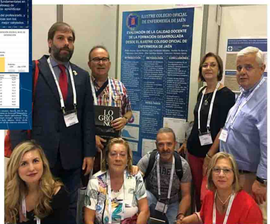
Enfermeros posan junto a su póster.