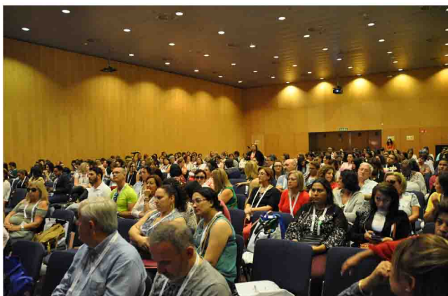
Una de las salas de conferencias en el CIE.

En el programa del CIE se han tratado los temas más candentes para los profesionales, como son los Sistemas de Salud, salud sostenible o recursos humanos, entre otros. El encuentro ha contado con una serie de mesas temáticas que abordarán los problemas que afectan al desarrollo de la enfermería en nuestro país. Con el nombre de "Mesas hispánicas", estos foros se han dedicado a temas tan relevantes como el empleo, la prescripción enfermera, seguridad en el trabajo o la gestión clínica, con intervenciones de ponentes españoles y extranjeros de primer nivel.