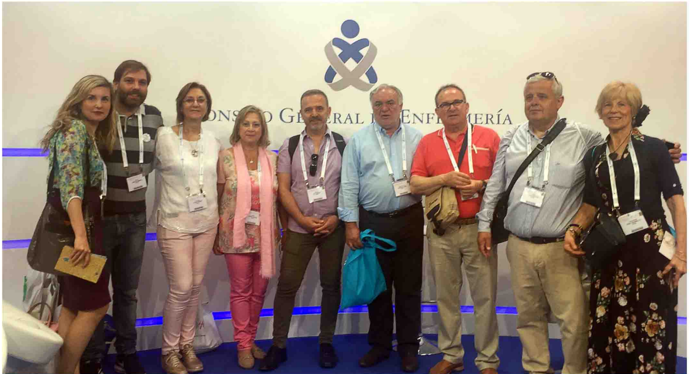
Algunos de los asistentes en el stand del Consejo General de Enfermería.

tos y experiencias. La cita en la Ciudad Condal ha batido todos los récords de comunicaciones orales y pósters, con una enorme muestra de las investigaciones que llevan a cabo las enfermeras españolas y, en particular, las andaluzas. De hecho, Andalucía es la segunda región española con mayor número de comunicaciones y pósters admitidos para presentar durante el congreso, con un total de 116 trabajos, de los cuales, 30 son comunicaciones orales y otros 86, pósters, lo que supone alrededor de un 15% de todos los estudios españoles que se presentan.