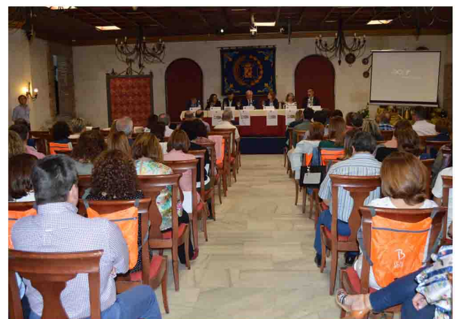
Panorámica de la sala durante el acto.