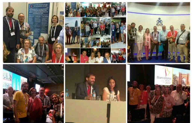
Algunos de los momentos vividos en el CIE.