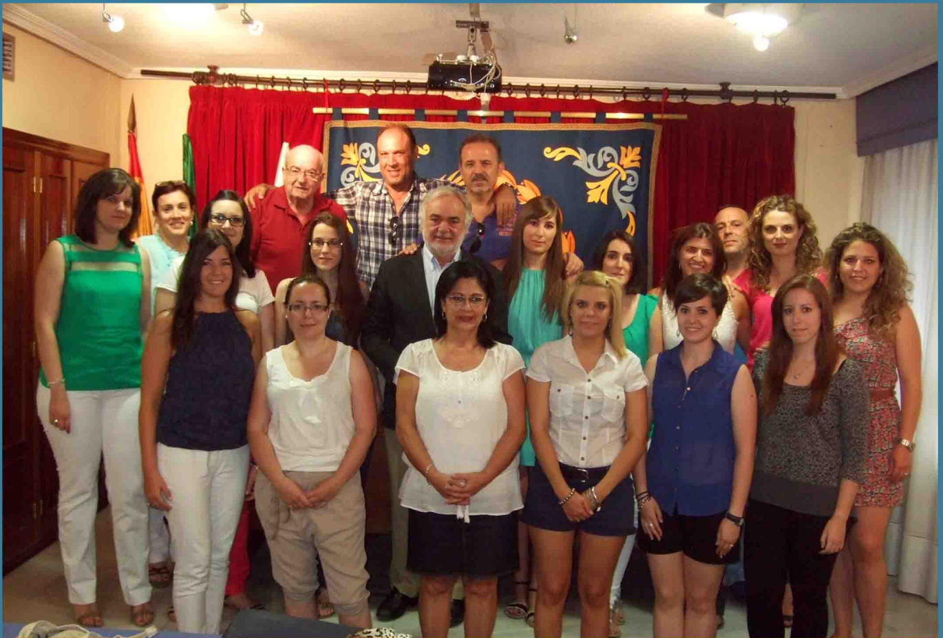
Clausura de uno de los cursos de Experto Universitario ofertado por el Colegio en ediciones pasadas.

La institución colegial mantiene abierto, hasta el 12 de septiembre, el plazo de inscripción de los tres cursos de experto universitario que ha ofertado para este curso 2017/2018. Estas acciones formativas de primer nivel cuentan con 20 créditos ECTS (500 horas) y son válidas para las áreas específicas de Enfermería de la Bolsa Única de Empleo del S.A.S. Serán impartidos en modalidad semi-presencial.