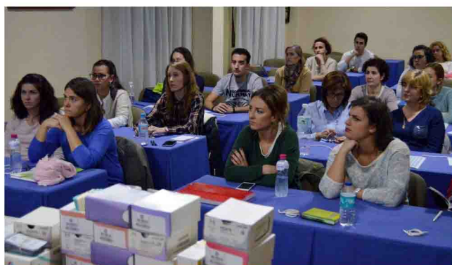
Alumnos en una edición pasada del mismo curso.

Esta acción formativa se desarrolla entre el 28 de septiembre y el 26 de octubre en Linares, en la Residencia Mixta de Pensionistas. El plazo para presentar las solicitudes ya está abierto y concluye el 20 de septiembre.