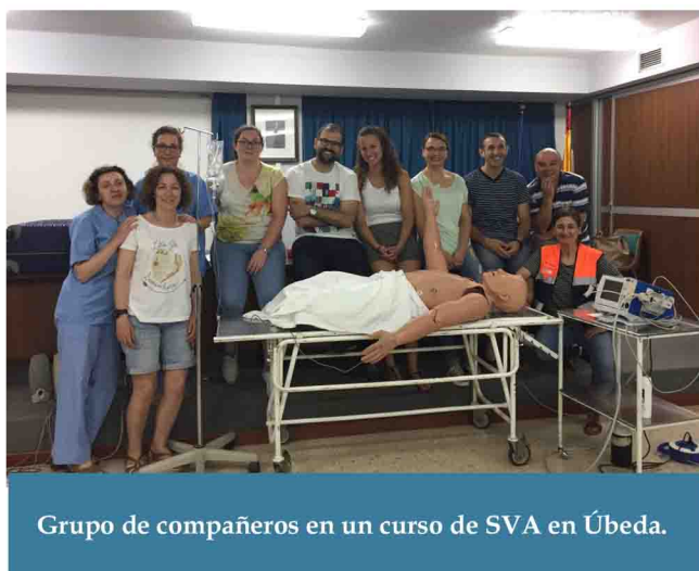
Grupo de compañeros en un curso de SVA en Úbeda.

El Colegio de Enfermería de Jaén oferta una nueva edición del curso de Soporte Vital Avanzado, una actividad formativa de gran prestigio y calidad, que se celebrará en Jaén a partir del 13 de septiembre. Esta acción formativa está acreditada por la Agencia de Calidad Sanitaria de Andalucía con 7,8 créditos y ha sido diseñado y programado por miembros de la institución colegial.