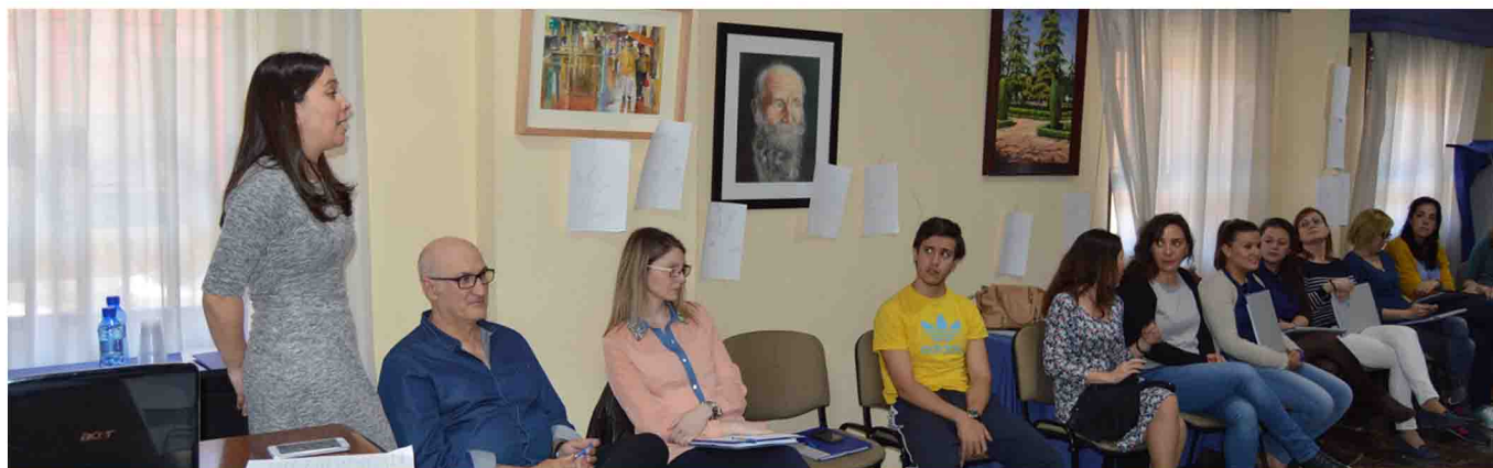
Imagen de una acción formativa celebrada en la sede colegial.

El Colegio Oficial de Enfermería de Jaén abre una nueva convocatoria de cursos de formación continuada acreditada: Cuidados de Enfermería al paciente diabético adulto e Iniciación a la Investigación.