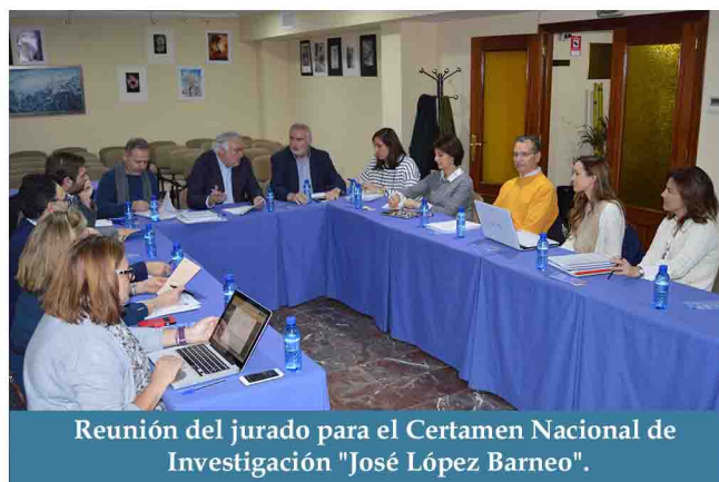
Reunión del jurado para el Certamen Nacional de Investigación "José López Barneo".

Un jurado integrado por expertos en cada sector elegirá los trabajos ganadores y los premios se entregarán en un acto público con motivo de la festividad del Patrón de la Enfermería, San Juan de Dios, en el mes de marzo.