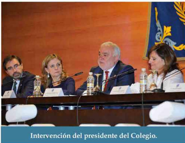
Intervención del presidente del Colegio.