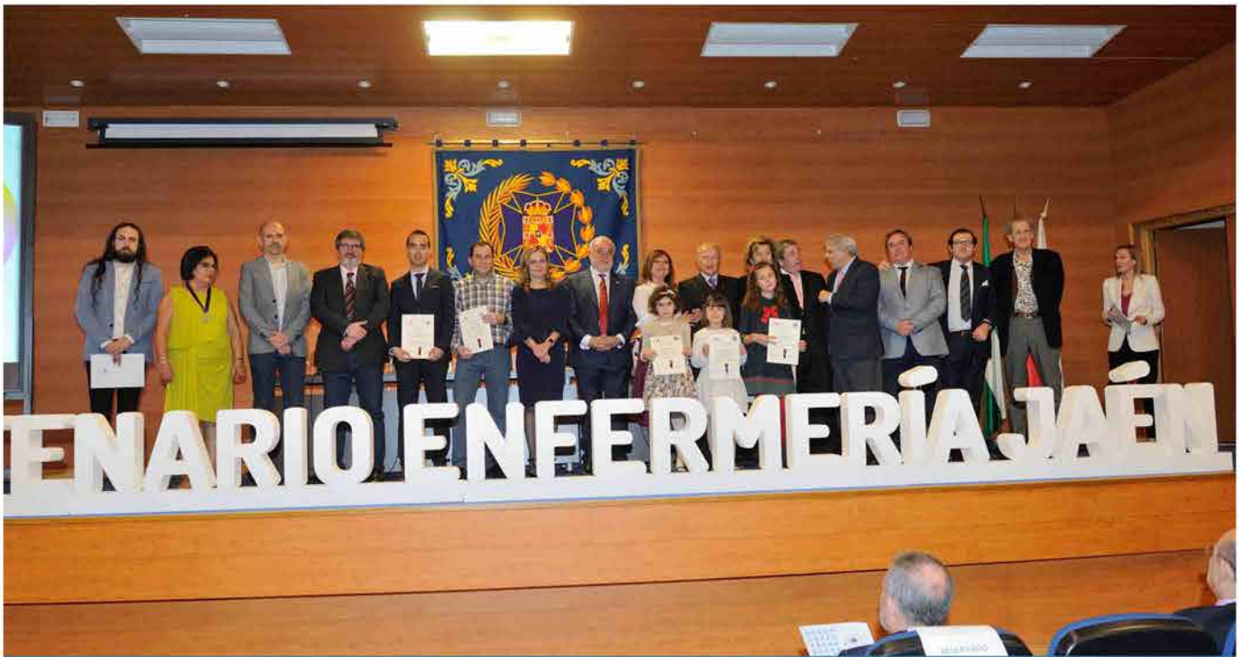
Foto de familia con los premiados y las autoridades.