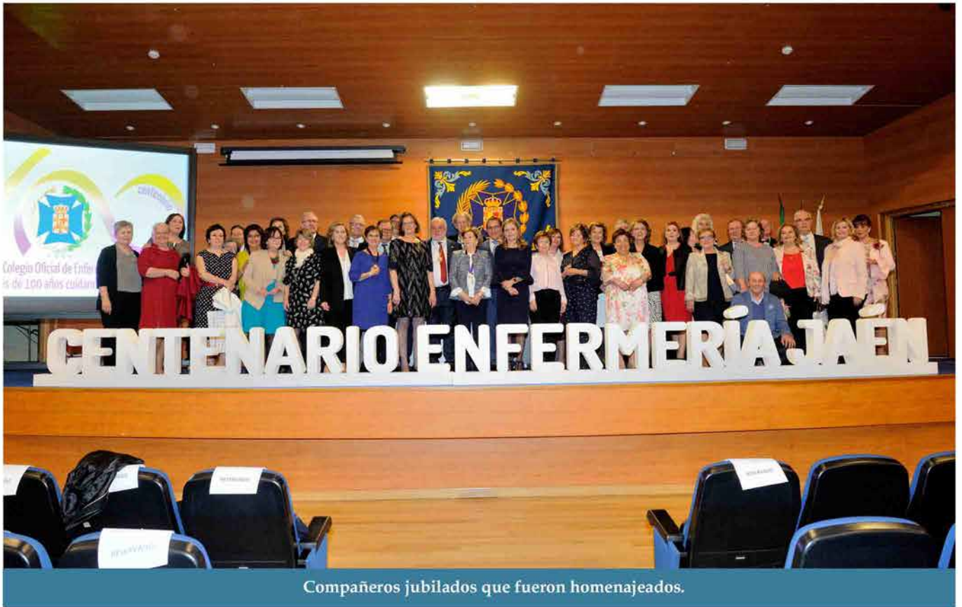
Compañeros jubilados que fueron homenajeados.