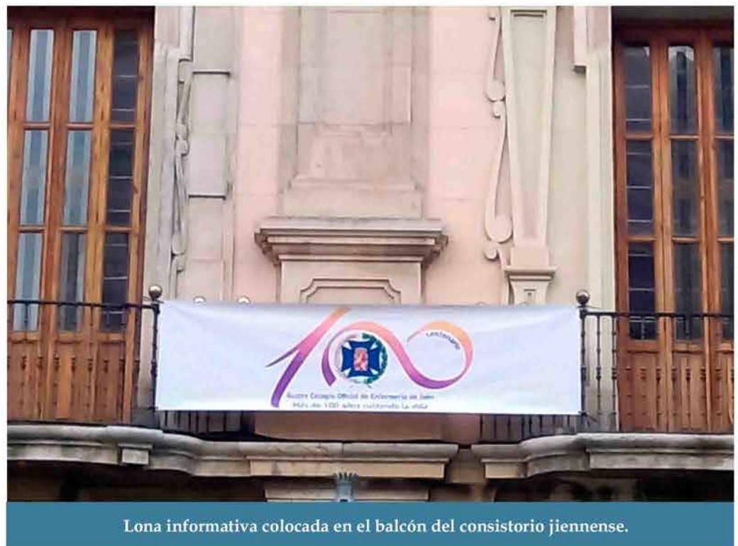
Lona informativa colocada en el balcón del consistorio jiennense.