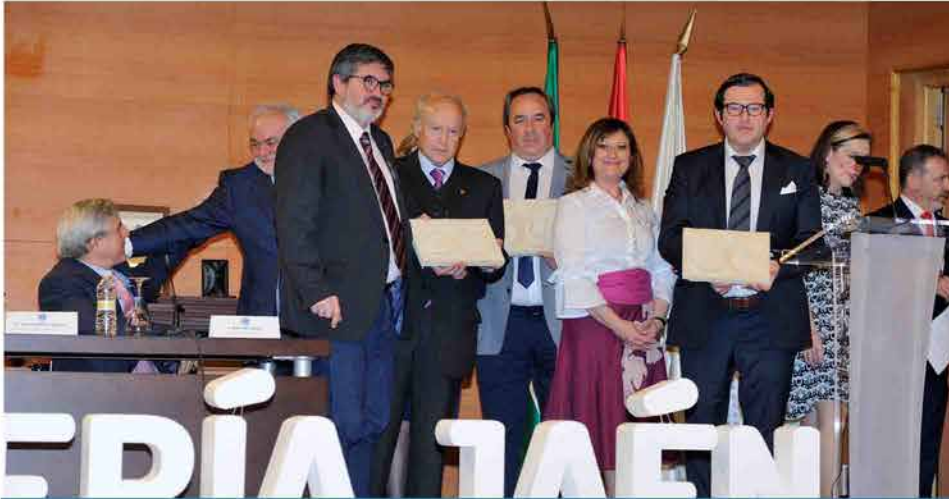
Reconocimiento a los técnicos de la residencia de mayores del Colegio.

En este mismo acto se ha reconocido públicamente el buen trabajo desarrollado por los técnicos de la Residencia de Mayores del Colegio de Enfermería de Jaén.