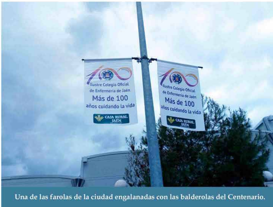
Una de las farolas de la ciudad engalanadas con las balderolas del Centenario.

Las calles de Jaén y la fachada de uno de sus edificios más emblemáticos, como es el Ayuntamiento, ya lucen la imagen del Centenario del Ilustre Colegio Oficial de Enfermería. Aquí podéis ver algunas imágenes: