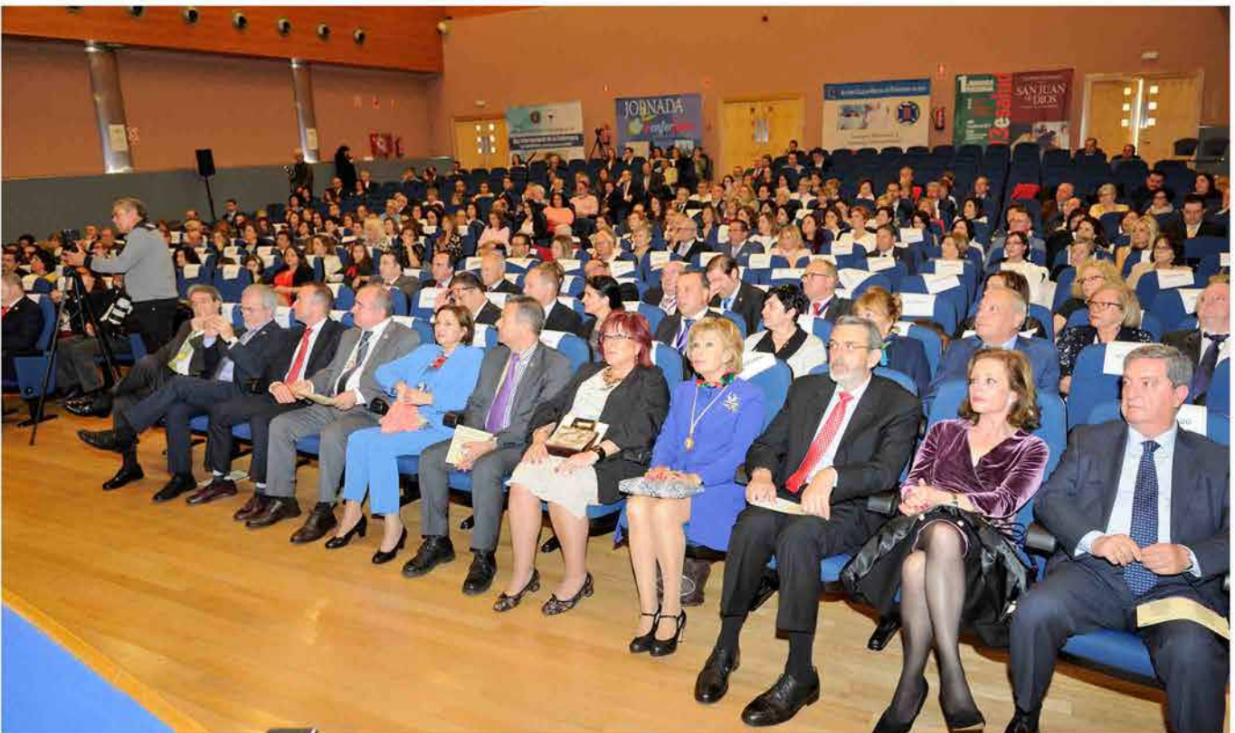
Representantes de los colegios andaluces.