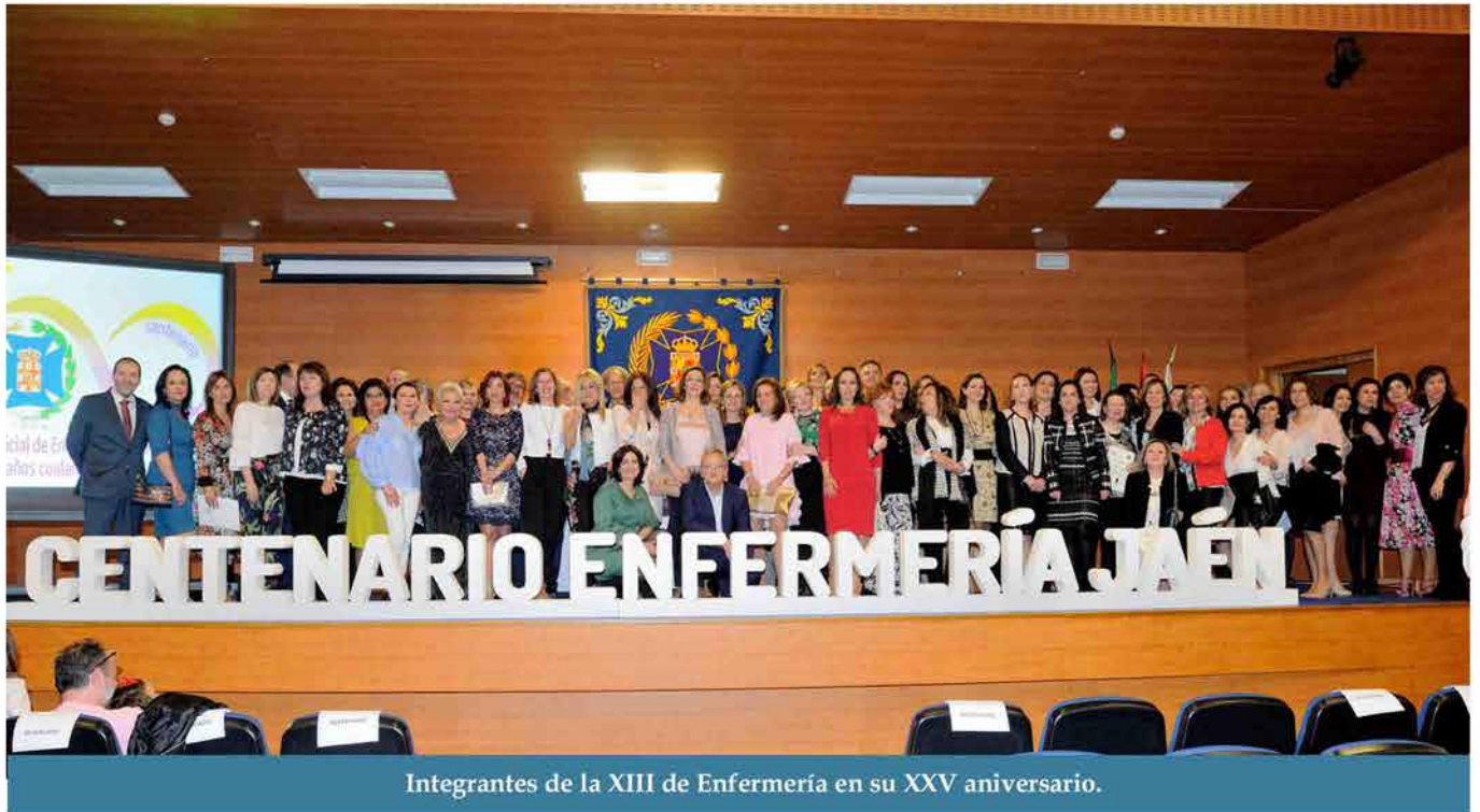
Integrantes de la XIII de Enfermería en su XXV aniversario.

Imposición de la Insignia de Oro Profesional a los compañeros y compañeras de la décimo tercera Promoción de Enfermería de Jaén en su 25 Aniversario.