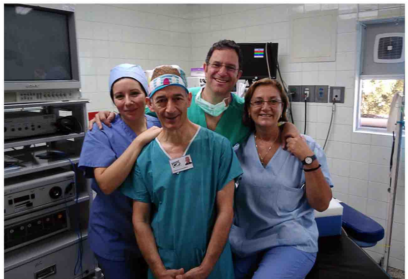
Imagen de archivo de una de las expediciones de Quesada Solidaria a Guatemala. ■