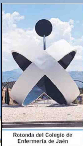
Rotonda del Colegio de Enfermería de Jaén