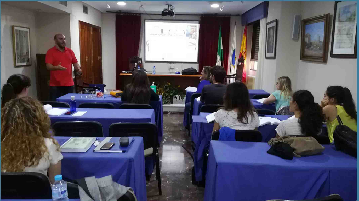
Uno de los últimos cursos impartidos en la sede colegial.

El Ilustre Colegio Oficial de Enfermería de Jaén ofertó más de 400 plazas de formación en el mes de septiembre a través de diversas acciones de formación continuada y cursos de expertos universitarios.