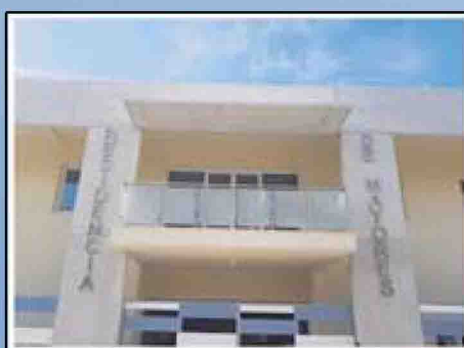
Residencia de Mayores del Colegio de Enfermería de Jaén

Ilustre Colegio Oficial de Enfermería de Jaén