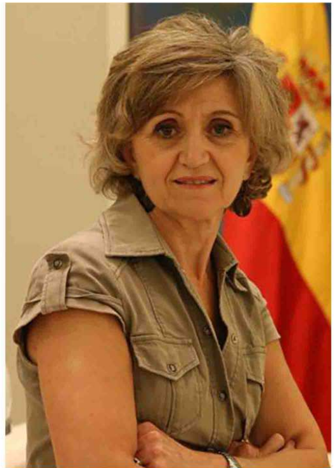
María Luisa Carcedo, ministra de Sanidad, Consumo y Bienestar Social.

Este posicionamiento constituye, a su vez, un impulso para afianzar el compromiso de la profesión enfermera de no admitir que se pretendan privatizar unas actuaciones a través de las oficinas de farmacia, que en todo caso, son establecimientos comerciales privados con ánimo de lucro, que a su vez dispensan medicamentos financiados por el Sistema Público de Salud.