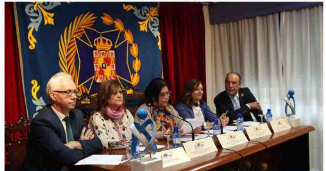
Autoridades en la inauguración de la jornada.