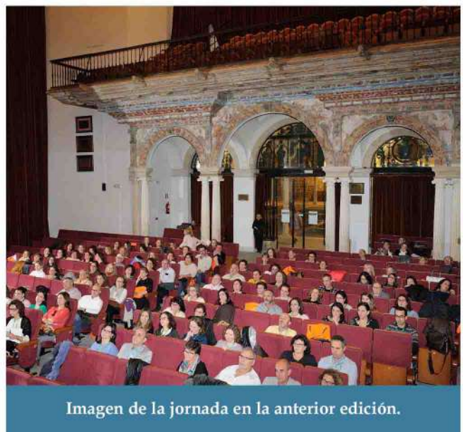
Imagen de la jornada en la anterior edición.