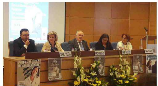
Mesa inaugural del Encuentro.

A lo largo del encuentro, se defendió la especialidad de enfermería de salud mental, exigiendo al Servicio Andaluz de Salud acciones prioritarias para la implantación definitiva de las enfermeras especialistas en salud mental.