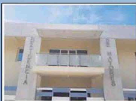
Residencia de Mayores del Colegio de Enfermería de Jaén

Ilustre Colegio Oficial de Enfermería de Jaén