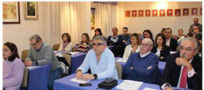
La actividad formativa ha contado con una veintena de alumnos.