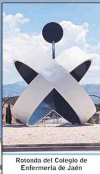
Rotonda del Colegio de Enfermería de Jaén