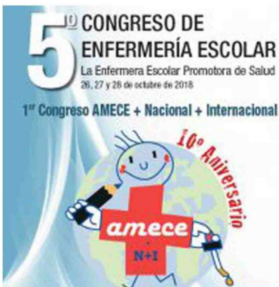
Imagen de la pasada edición de la jornada.

Los pasados 26, 27 y 28 de octubre tuvo lugar el Congreso Internacional de Enfermería Escolar en Madrid, bajo el lema "La enfermera escolar, promotora de salud". El objetivo de esta cita fue destacar que el desempeño enfermero dentro de los centros educativos no debe circunscribirse exclusivamente a la atención de los problemas de salud, sino que también se debe realizar un trabajo exhaustivo, junto con toda la comunidad educativa, en la promoción de hábitos de vida saludables.