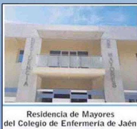
Residencia de Mayores del Colegio de Enfermería de Jaén

Ilustre Colegio Oficial de Enfermería de Jaén