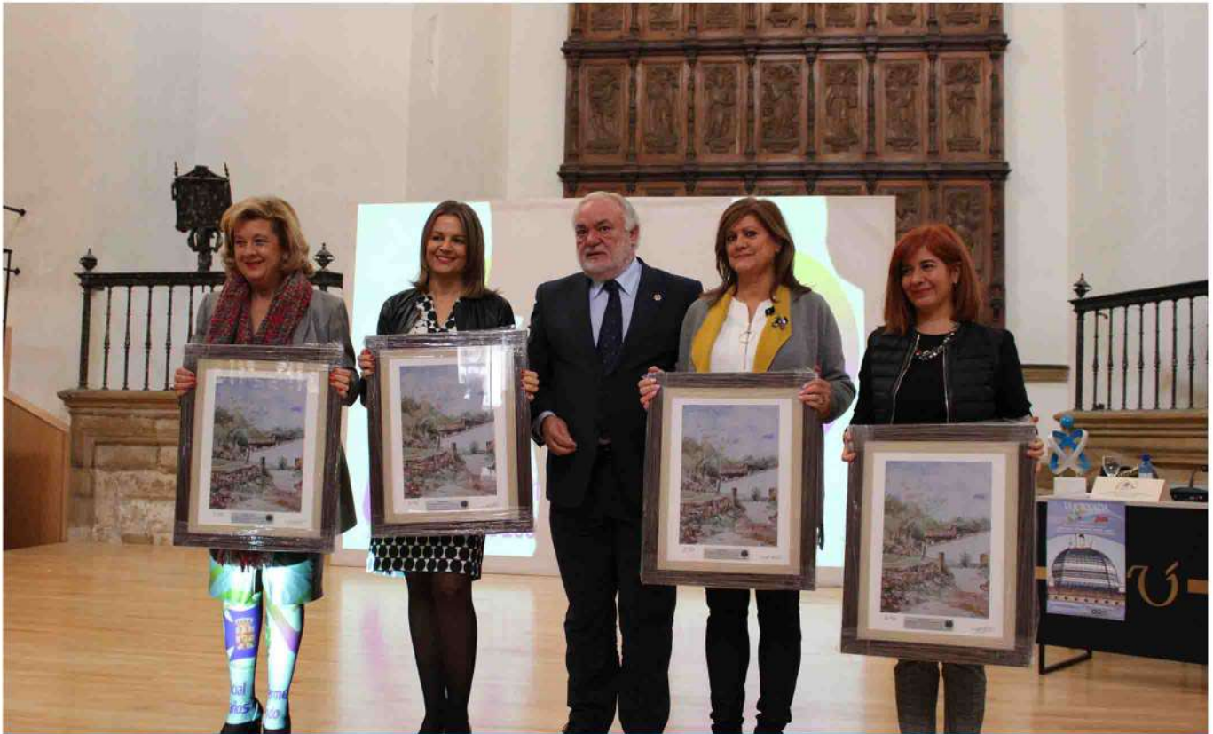
La entidad colegial hizo entrega de un cuadro conmemorativo a las autoridades y ponentes participantes.