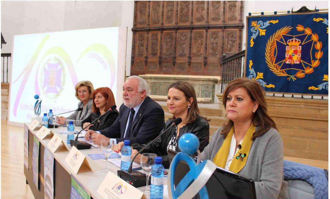
Mesa inaugural de la jornada.