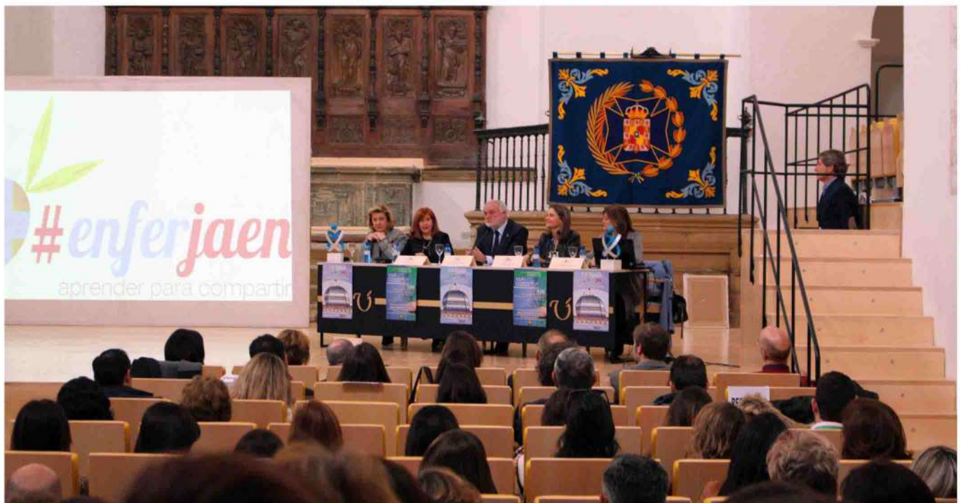
Panorámica del Auditorio.