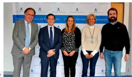
Representantes de Separ y del Consejo General de Enfermería.

Consideran que es clave para "conseguir el reconocimiento por parte del Ministerio de Sanidad"