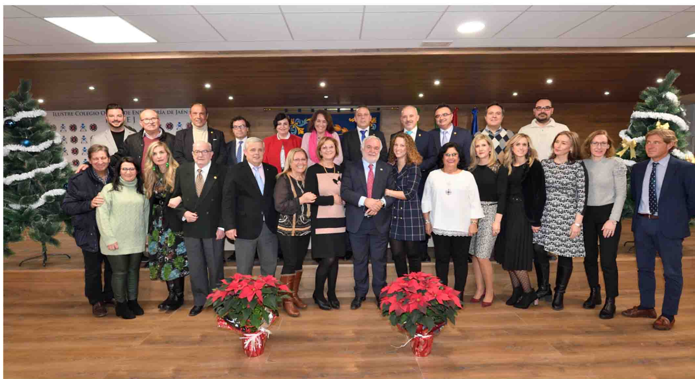
Miembros de la Junta de Gobierno, trabajadores y colaboradores del Ilustre Colegio Oficial de Enfermería de Jaén.