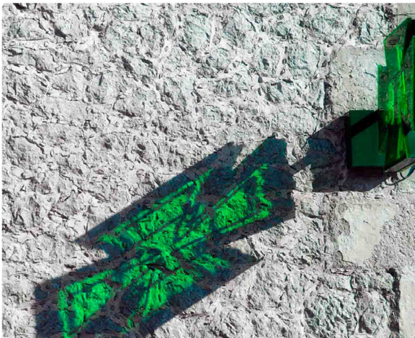
Los farmacéuticos no tienen preparación para actuar si el paciente sufre una reacción adversa o complicación como consecuencia de la vacunación