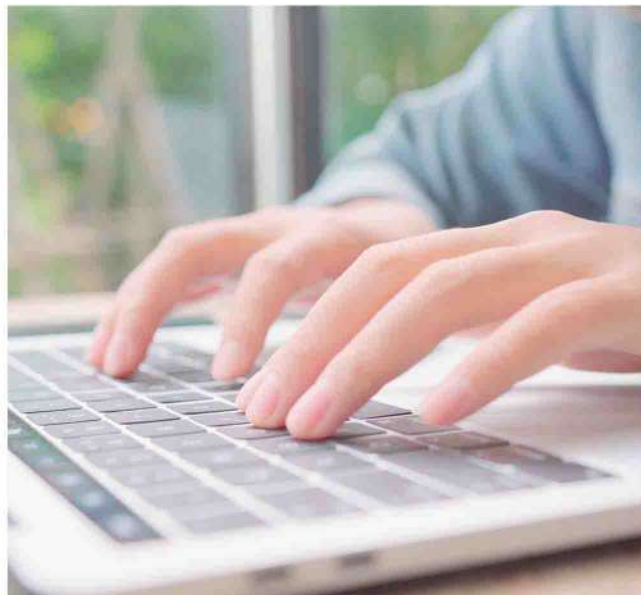
■ Formación online.