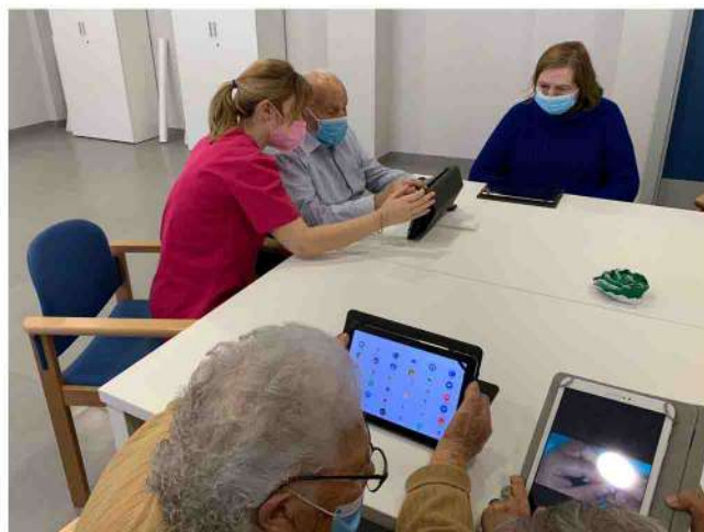
■ Los residentes aprenden a manejar la tablet.

sentir que aún tienen edad para aprender y enfrentarse a nuevos retos algo impensable hasta ahora para muchos de ellos.