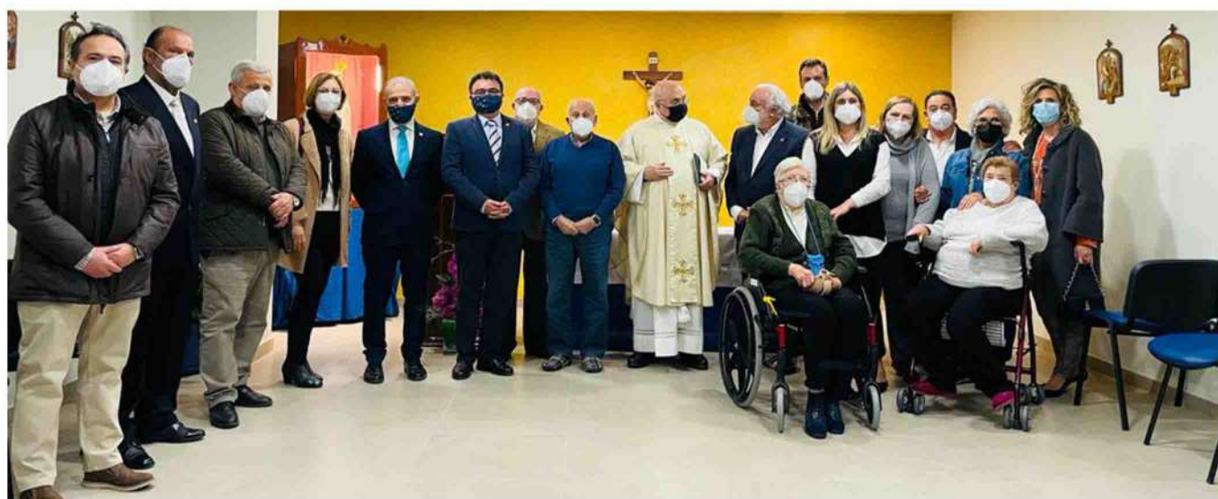
■ Autoridades y usuarios de la Residencia durante el acto.