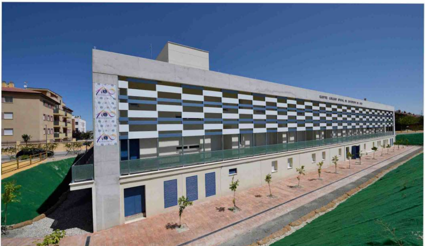
Panorámica de la Residencia de Mayores.

Desde la Residencia de Mayores del Ilustre Colegio Oficial de Enfermería ayudamos, asesoramos y colaboramos con nuestros residentes y sus familiares en la tramitación de todas estas gestiones.