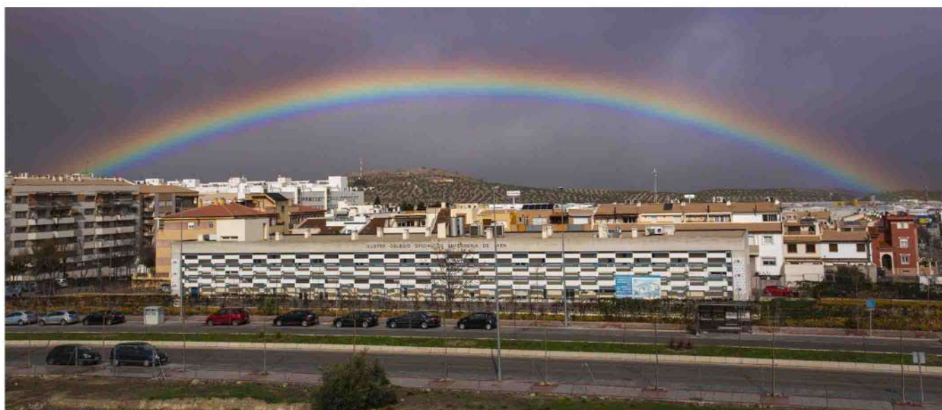
■ La residencia de mayores del ICOEJ.