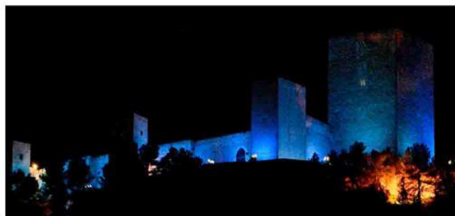
■ El Castillo de Santa Catalina iluminado de azul.