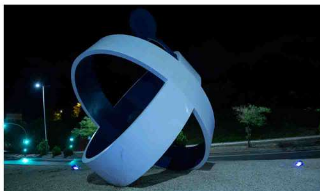
■ La rotonda dedicada al ICOEJ.