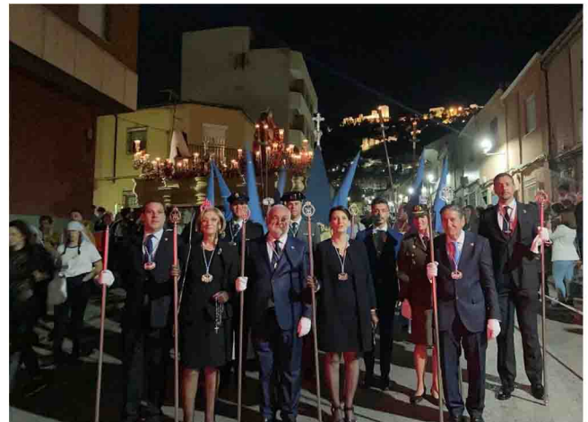
Procesión del Lunes Santo.