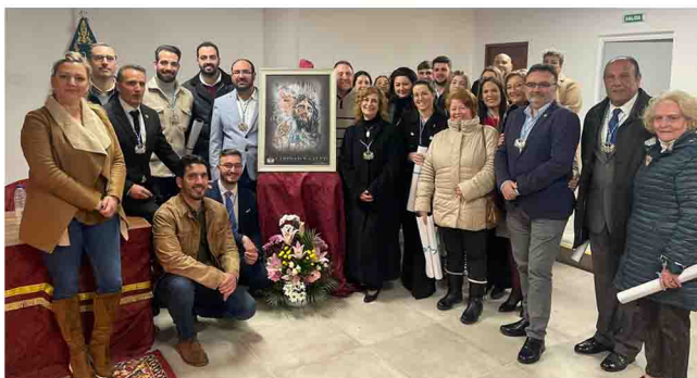
Acto de presentación del cartel.