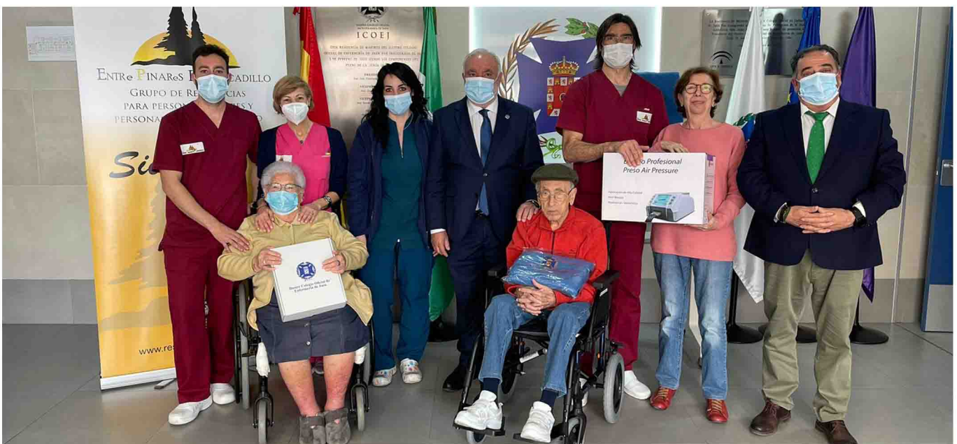
Regalos recibidos por los residentes.