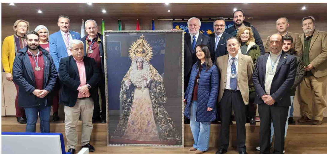
Entrega del cuadro a tamaño natural de la Virgen de la Salud.