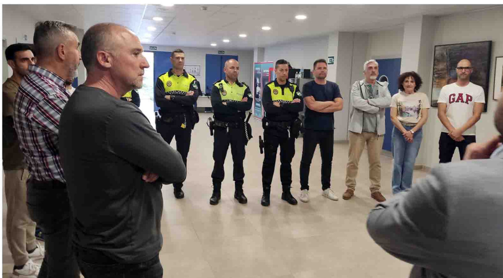
Una sesión del curso a policías locales de Jaén.