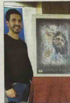
ADORO Autor del cartel de Caridad y Salud 2023

hora, el pregonero mantuvo en vivo al auditorio, con incursiones poéticas, con raigambre mariana en recuerdo a su madre y con un especial sentimiento de respeto hacia un mundo que no frecuenta, pero le apasiona: "No soy cofrade, pero sí que siento, sí que oigo, toco, veo, huelo, palpo, vivo, participo, sigo, persigo y anhele la ilusión de un trono entre la gente que se agolpa en las aceras para ver esas manos acogedoras de Jesús, esas lágrimas que a la Virgen de la Salud subliman en su trono", abundó Lendínez entre aplausos del público.