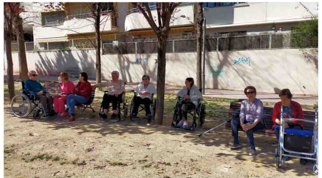
Talleres de estimulación cognitiva al aire libre.