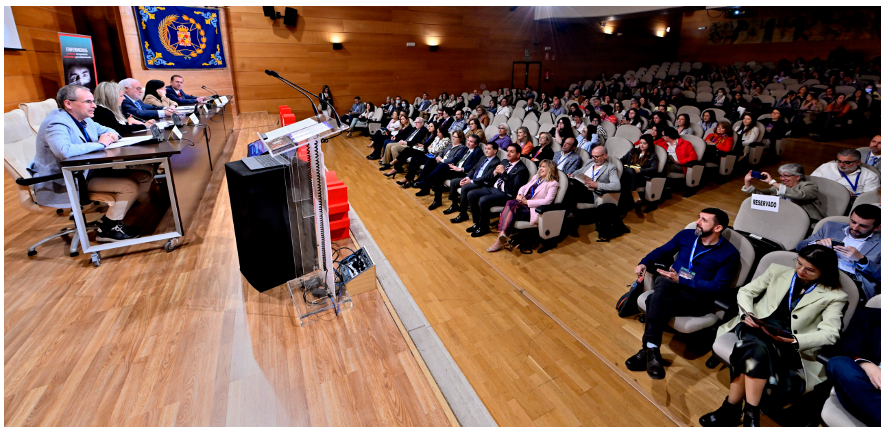
■ Panorámica de la inauguración de la jornada.