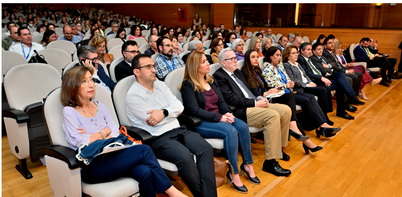
■ Panorámica del público asistente.