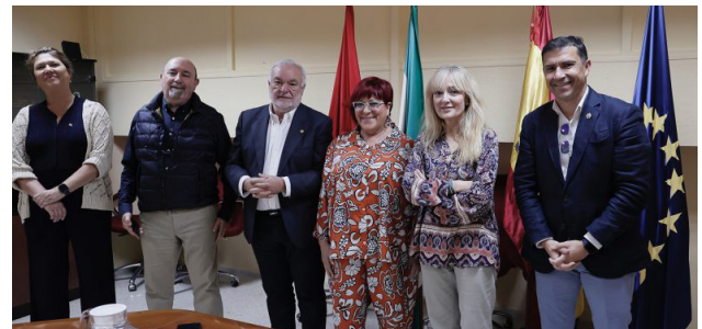
■ Responsables del CAE y de UGT Andalucía.

Durante la reunión, enmarcada en los encuentros que el Consejo Andaluz viene desarrollando con los distintos sindicatos, se han tratado las principales preocupaciones y necesidades del colectivo de Enfermería en Andalucía, así como la importancia de mejorar el reconocimiento social y económico de la profesión.