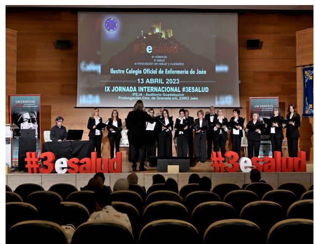
■ Cantoría de Jaén.