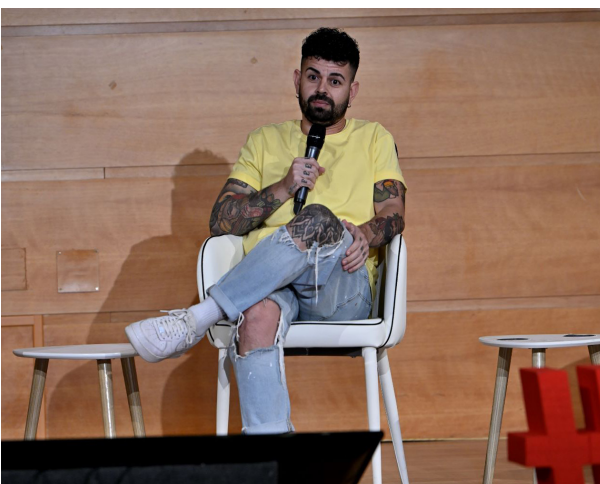
■ El humorista Guelmi.