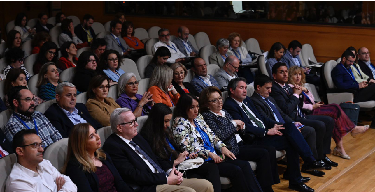
■ Público asistente.