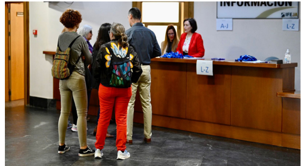
■ Mesa de inscripciones.