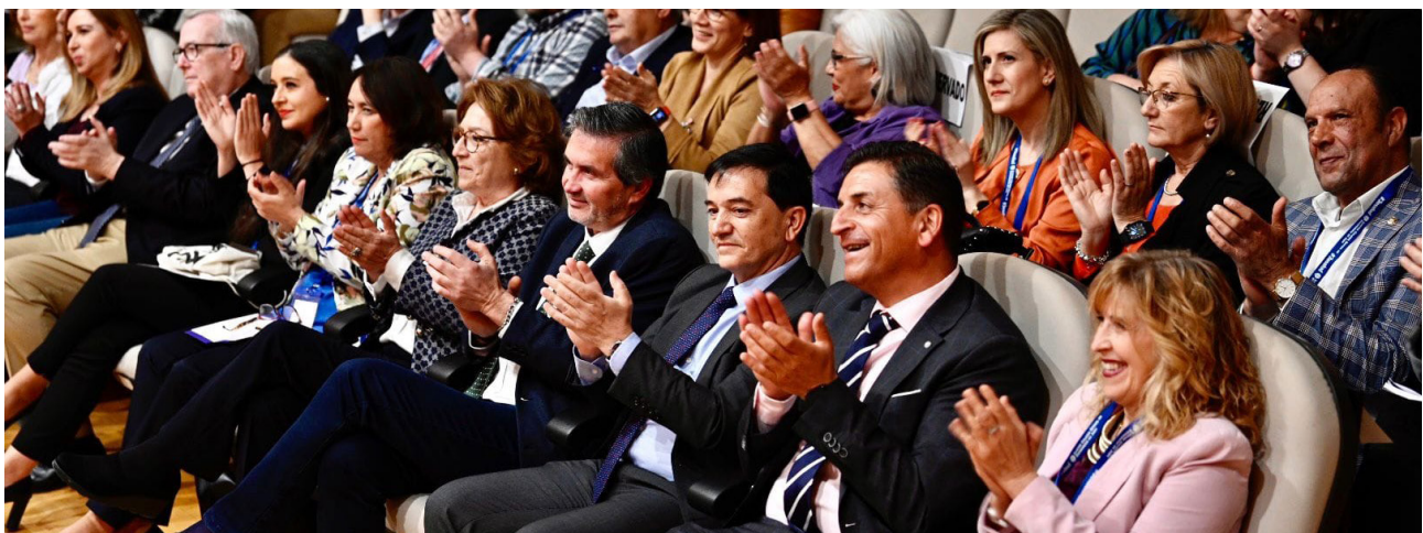
■ Público asistente.