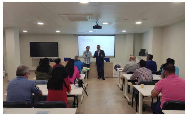
■ El curso se celebró en las aulas de la Residencia del ICOEJ.

La parte práctica se ha centrado en aprender a usar con rapidez y seguridad el DEA (Desfibrilador Externo Automático) y en aplicar las técnicas manuales de reanimación. Además, el curso ha tratado la cadena de supervivencia, técnicas ante una parada cardiorespiratoria y resucitación cardiopulmonar. Además de Protección Civil de Porcuna, esta formación la han recibido los agentes de la Policía Local de Jaén, y en breve se va a hacer extensión al Cuerpo Nacional de Policía, Guardia Civil y Policía Local de otras localidades como por ejemplo Torredonjimeno.