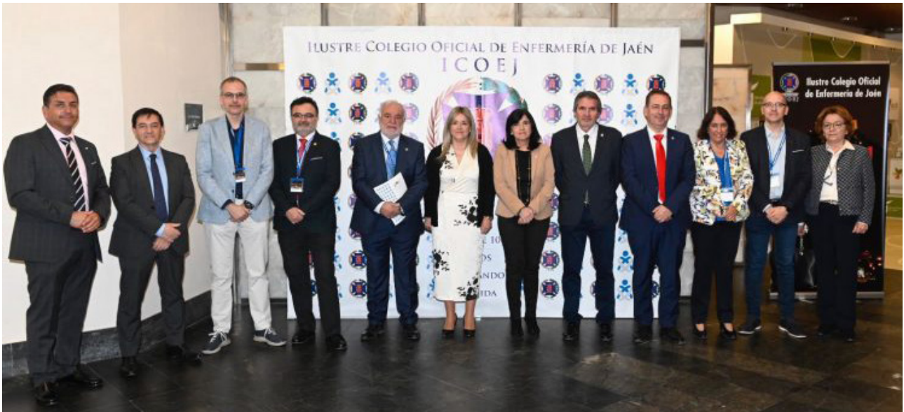
■ Autoridades asistentes a las jornadas.

Más de 600 enfermeras de diferentes puntos del país y el extranjero participan en este congreso organizado por el Ilustre Colegio Oficial de Enfermería de Jaén