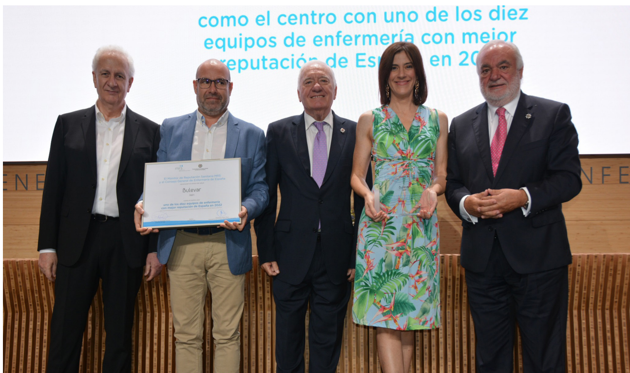
■ Acto de entrega del premio.

Hospitales, centros de salud, centros sociosanitarios, direcciones de Enfermería, o fabricantes... han recibido el reconocimiento del Consejo General de Enfermería y MRS en un acto en la sede del Consejo General de Enfermería, según el ranking del Monitor de Reputación Sanitaria (MRS) han recibido Durante el acto también se ha hecho entrega también de los galardones a las empresas fabricantes de productos sanitarios con mejor reputación para las enfermeras. En esta ocasión, el ranking, que va por su octava edición, ha contado con la participación de 2.360 profesionales de la enfermería, de 267 gestores de enfermeros y de 241 gerentes y directivos de hospitales. De esta forma, MRS y el Consejo General de Enfermería se reafirman una vez más en su apuesta por el liderazgo enfermero y el reconocimiento de las enfermeras.