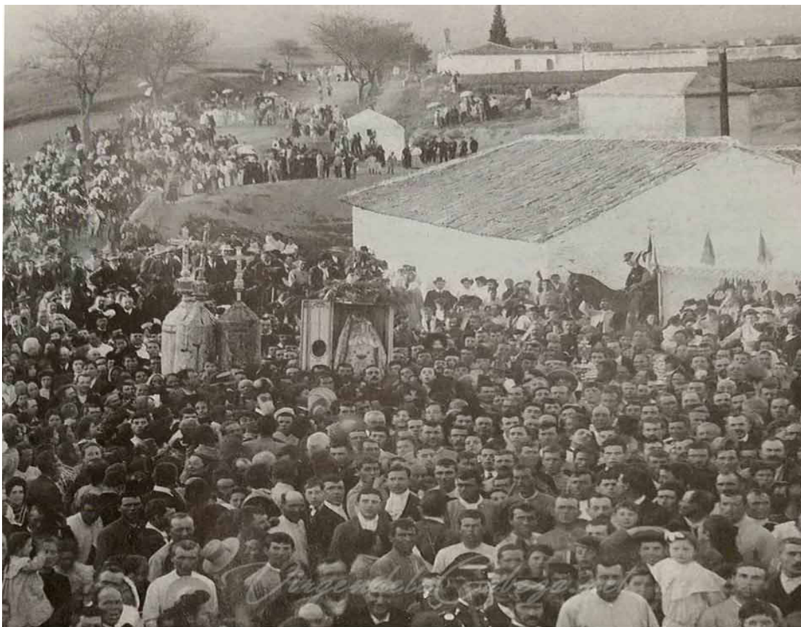
Coronación Canónica de la Virgen de la Cabeza y llegada a Andújar en 1909

Desde aquí invitamos a todo el que lo desee a participar en esta mirada al pasado a través de la fotografía y nos haga llegar sus imágenes antiguas a través del email formacion@enfermeriajaen.com .