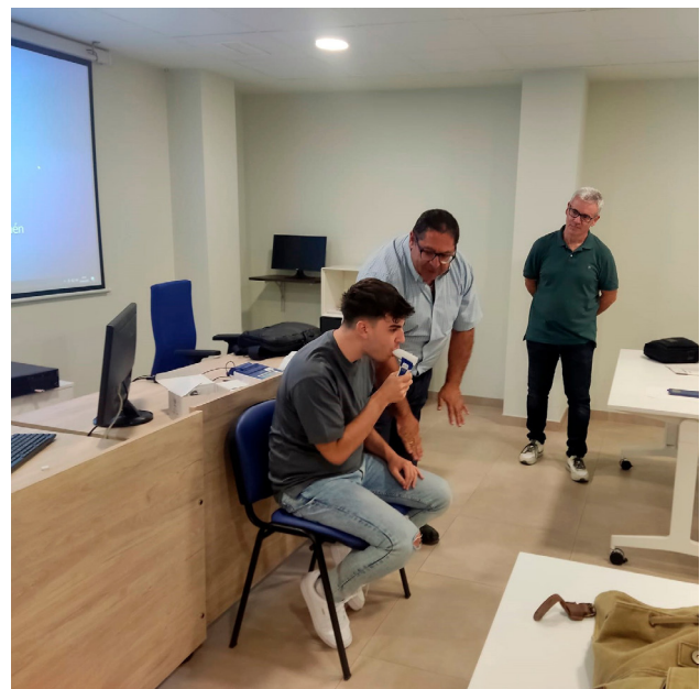
■ Esta prueba evalúa la función pulmonar.