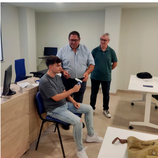
■ La formación fue práctica.