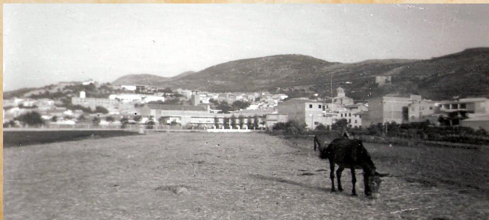
■ Imágenes de Huelma con el Castillo y la Iglesia al fondo.

Desde aquí invitamos a todo el que lo desee a participar en esta mirada al pasado a través de la fotografía y nos haga llegar sus imágenes antiguas a través del email formacion@enfermeriajaen.com .