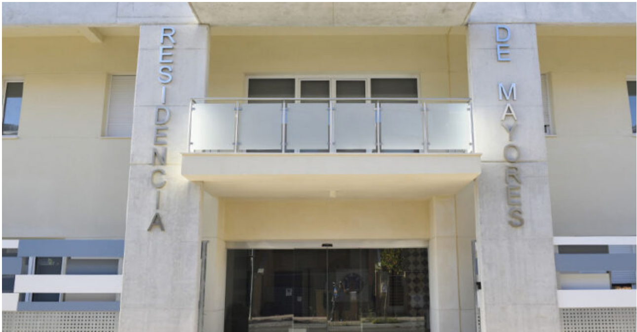
■ Fachada de la Residencia de mayores del Ilustre Colegio Oficial de Enfermería de Jaén.