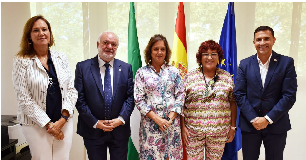
■ La reunión con la consejera se celebró en sede de la Consejería de Salud y Consumo.

Por otro lado, desde el CAE se abordaron los necesarios cambios en la baremación de méritos por la experiencia profesional en la Bolsa única SAS, así como la reivindicación de que las unidades de gestión clínica estén dirigidas por profesionales de enfermería.