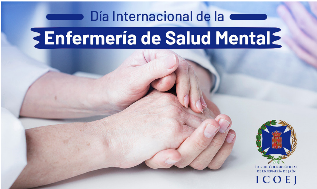
■ Cartel del Día Internacional de la Enfermería de Salud Mental.