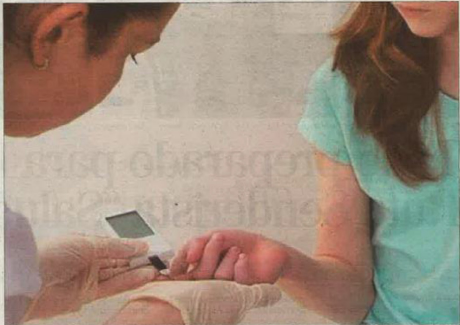
ATENCIÓN. Una enfermera escolar asiste a una alumna durante el curso en una foto de archivo.

Por su parte, el Icoej cuenta con un grupo de trabajo para reivindicar la implantación de la Enfermera Escolar. Desde el Colegio recuerdan que la entidad es pionera en la lucha por la incorporación de un profesional de la Enferme-