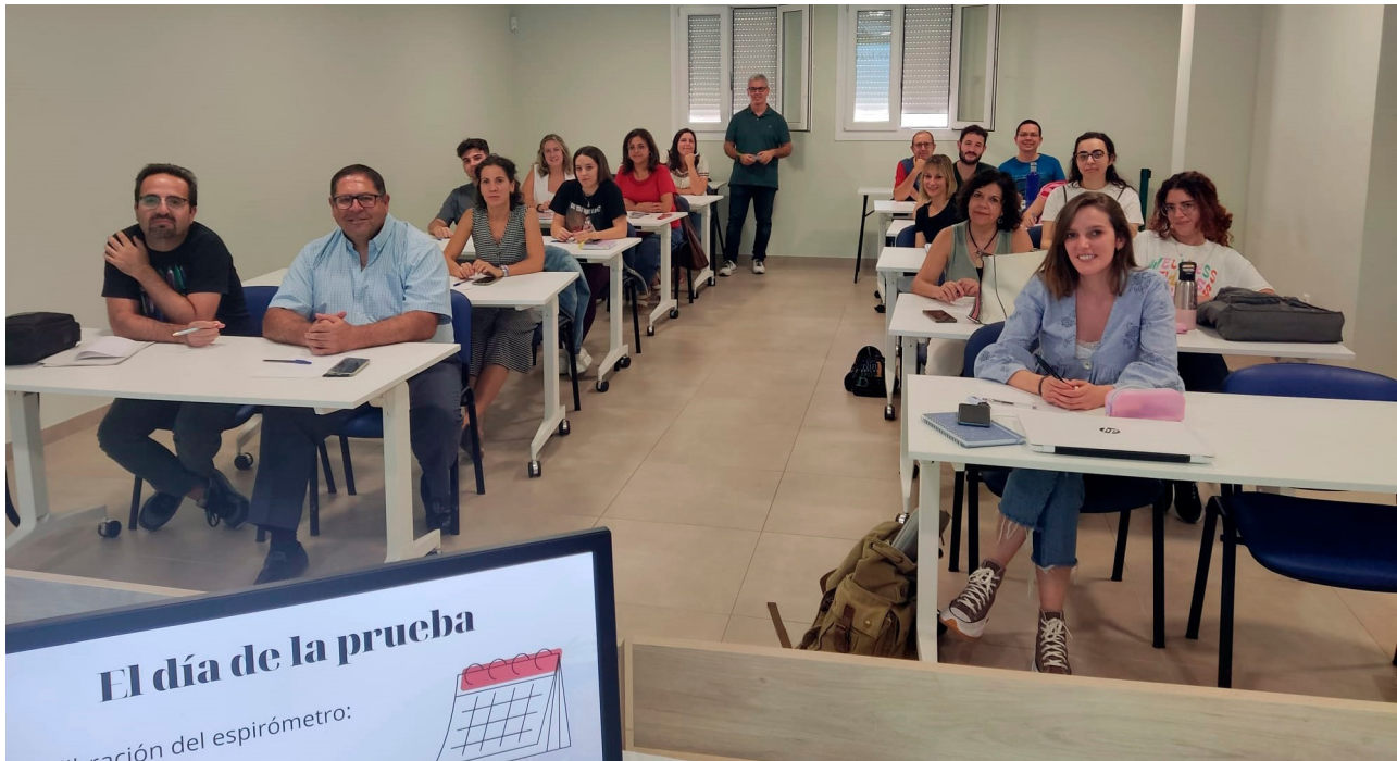
■ Una veintena de profesionales de la enfermería participaron en esta formación.

aulas de formación de la Residencia del ICOEJ. Este procedimiento se utiliza con frecuencia para evaluar la función pulmonar en las personas con enfermedades pulmonares como asma o fibrosis quística