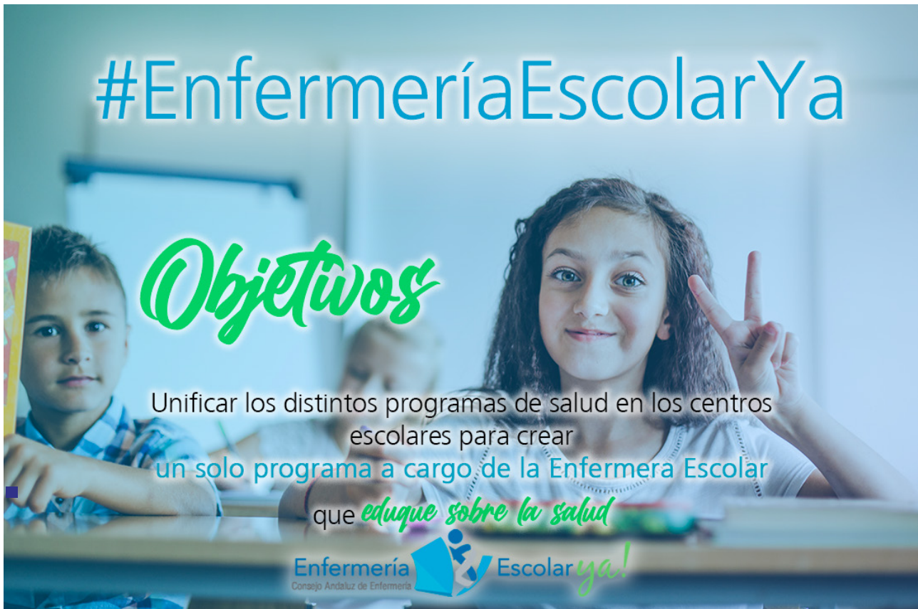
■ Imagen de la campaña "Enfermería Escolar Ya".

El Colegio de Enfermería de Jaén recalca que el principal cometido de esta figura es velar por la prevención y atención sanitaria de la población escolar en los centros educativos