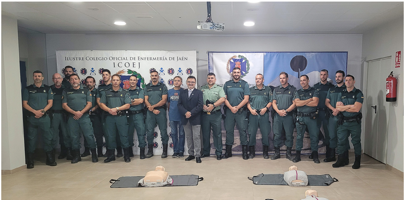
Jornada de formación en técnicas de primeros auxilios y de reanimación dirigida a agentes de la Guardia Civil.