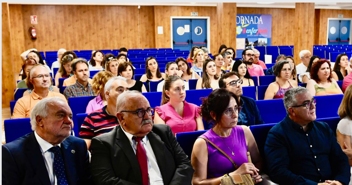
■ El acto contó con una importante participación.

mentales como la ansiedad o la depresión. Se hizo especial énfasis en el insomnio, el trastorno del sueño más frecuente, se destacó que el 14% de la población adulta española padece insomnio crónico y que el 35 % ha sufrido insomnio ocasional o transitorio en situaciones estresante, por lo cual se considera al insomnio la nueva pandemia del siglo XXI. Las ponentes hicieron hincapié en la importancia de una adecuada valoración del patrón del sueño por parte de las enfermeras, además de realizar un abordaje adecuado e integral de los problemas del sueño y descanso a través de un plan de cuidados de enfermería individualizado, dando especial importancia a la educación para la salud, a los hábitos de la higiene del sueño, a abordajes cognitivo-conductuales como: control de estímulos, intención paradójica, técnicas de relajación, con el objetivo de promover un sueño saludable, evitando o reduciendo el uso de psicofármacos como las benzodiazepinas, y otros hipnóticos.