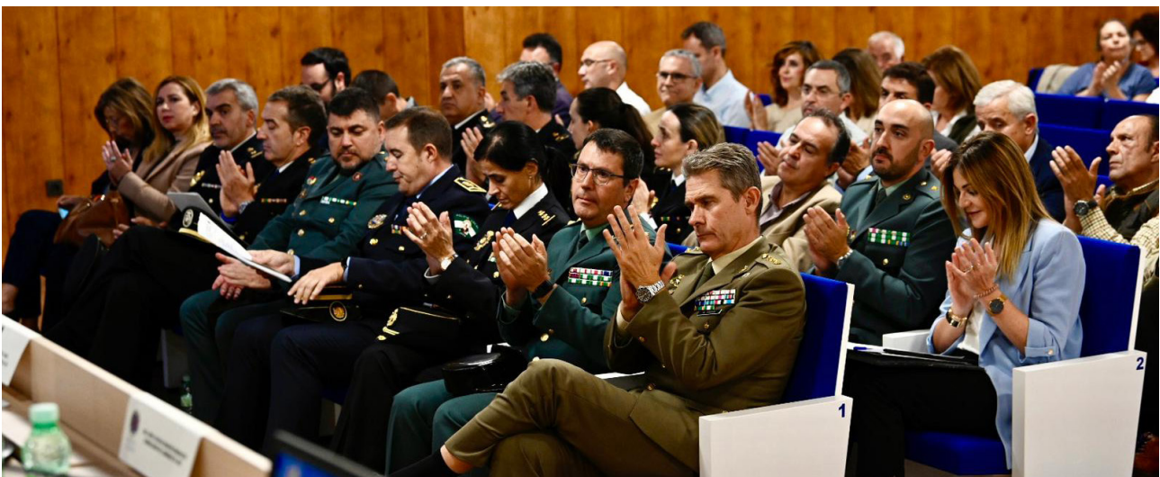
■ Numerosos profesionales de la enfermería y las fuerzas de seguridad asistieron a las Jornadas.