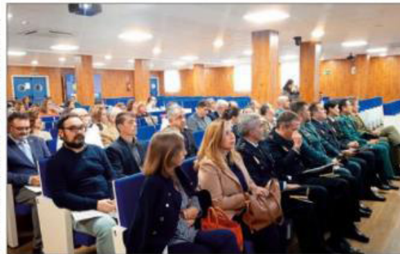
EXPECTACIÓN. Público asistente a la jornada promovida por el Colegio Oficial de Enfermería de Jaén.

El encuentro sirvió para hacer públicos los datos de la última encuesta realizada por el Colegio de Enfermería, que constata que prácticamente todos los miembros del gremio en la provincia han sido objeto de ataques, en sus variadas versiones, que van desde insultos y amenazas hasta agresiones físicas. En cuanto al perfil, casi tres cuartas partes, el 73,79% es de sexo