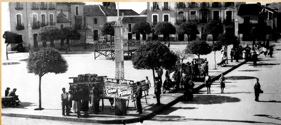
■ Imágenes de La Carolina.

Desde aquí invitamos a todo el que lo desee a participar en esta mirada al pasado a través de la fotografía y nos haga llegar sus imágenes antiguas a través del email formacion@enfermeriajaen.com .