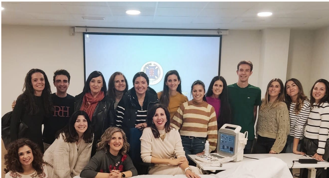
■ Una veintena de profesionales de la enfermería participaron en esta formación.

consiste en la visualización del embrión o feto dentro del útero materno. Se trata de un método de diagnóstico imprescindible durante el embarazo. Hoy en día, se establece un control ecográfico seriado.