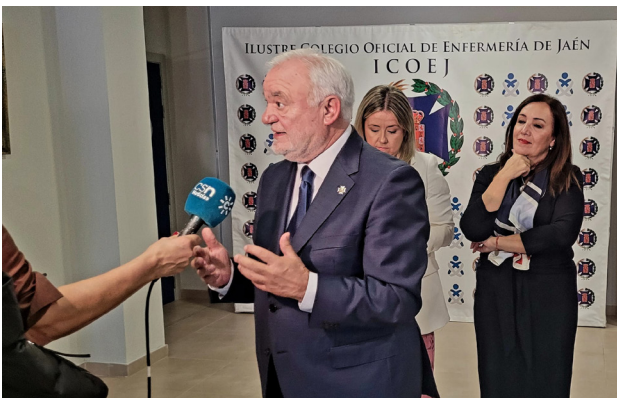
■ El presidente del ICOEJ en la atención a medios.

Entre los que reconocen haber sido víctima de tal acto violento destaca por encima de todos los tipos de agresión, la verbal, con un 39,16%. Le siguen de cerca los insultos y vejaciones con un 34,63% del total y, respecto a las amenazas, refleja este porcentaje un 10,68%, mientras que las agresiones físicas representan un 4,53%.