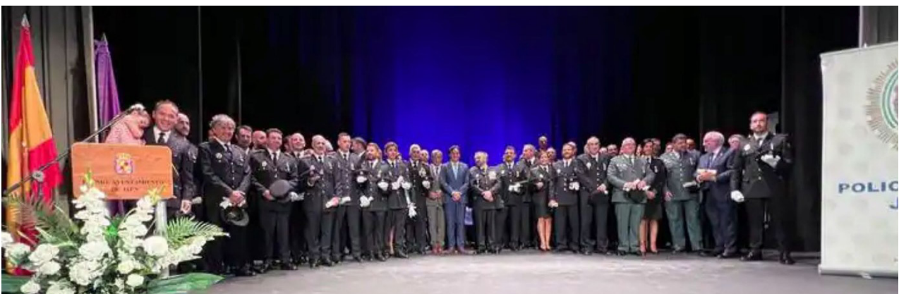
■ Foto de familia de los premiados en el Día de la Patrona de la Policía Local.

a la Policía Local como al Ayuntamiento de Jaén por esta concesión. “Es un verdadero honor recibir este reconocimiento que hago extensivo a mi Colegio, el Colegio de Enfermería de Jaén, y a las más de 4.800 enfermeras y enfermeros que conforman la realidad de esta institución colegial y que son el grueso de la sanidad en la provincia”, manifestó. Igualmente, el presidente del ICOEJ apuntó a la estrecha relación de la institución colegial con las diferentes Fuerzas de Seguridad, junto con las que se desarrollaron el 26 de octubre las II Jornadas de prevención de agresiones al personal sanitario.