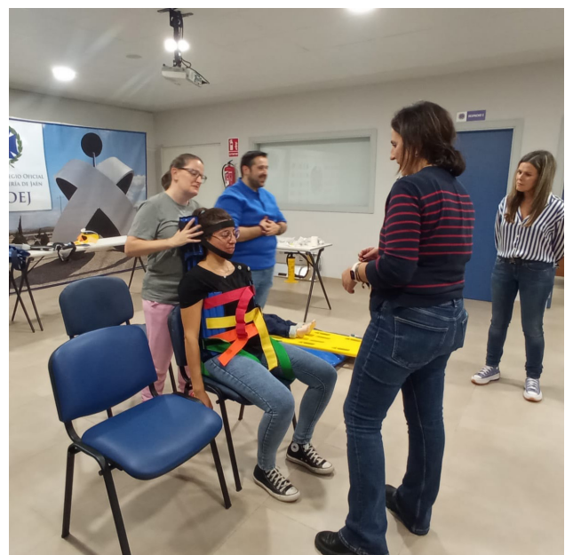
■ La inmovilización es esencial para pacientes graves.