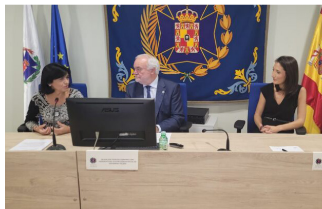
■ Momento de la inauguración de las jornadas.

“Puesto que el incremento de problemas mentales es cada vez mayor entre la población en general y muy especialmente, entre jóvenes y adolescentes, es imprescindible el desarrollo de la especialidad de enfermería de Salud