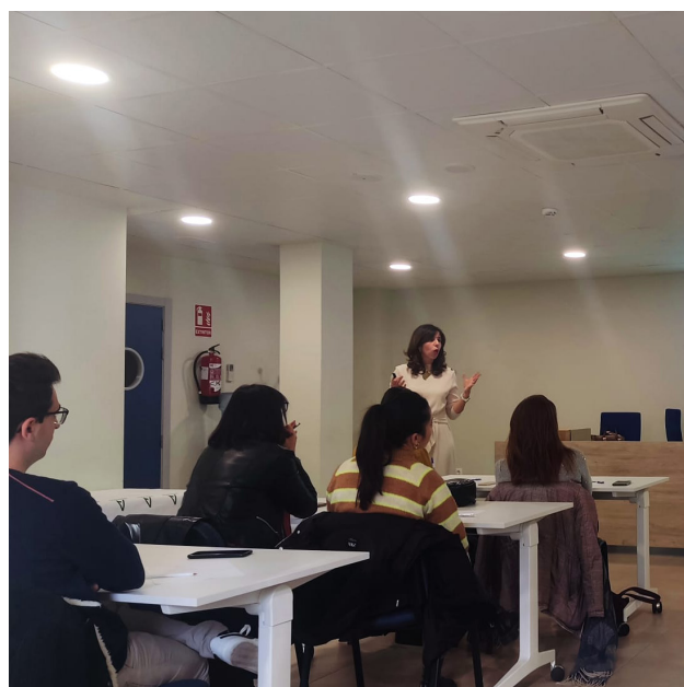
■ Desarrollo del curso de ecografía obstétrica.