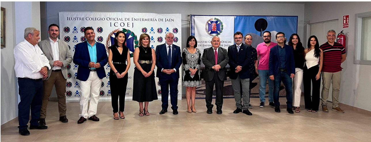
■ Foto de familia de la inauguración de las I Jornadas Provinciales de Enfermeras Especialistas en Salud Mental.