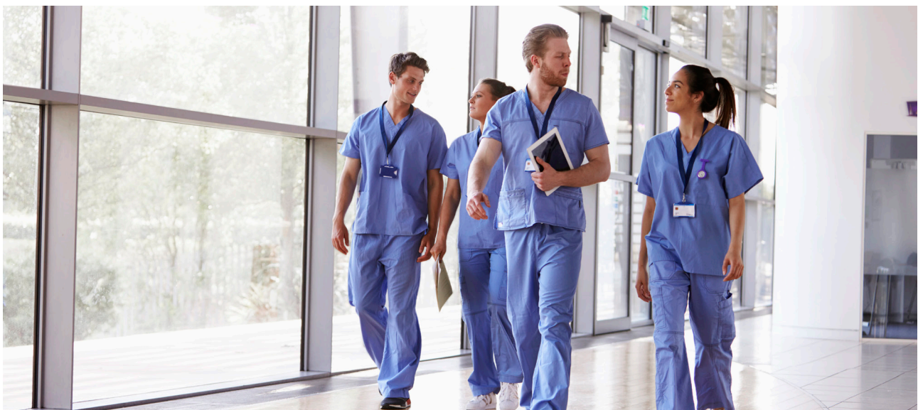
■ El estudio señala que dada la escasez de médicos de atención primaria en EE.UU, los enfermeros especializados son una fuente crítica de atención para muchos estadounidenses.

La Dra. Catherine Sarkisian, profesora y geriatra en la Universidad de California, Los Ángeles, estuvo de acuerdo. Dada la escasez nacional de médicos de atención primaria, los enfermeros especializados son una fuente crítica de atención para muchos estadounidenses, dijo Sarkisian, quien coescribió un editorial publicado con el estudio. Lo importante, dijo, es abordar la variación en la prescripción “a través de disciplinas”: ¿Por qué algunos proveedores representan una proporción desproporcionada de recetas potencialmente inapropiadas? Hay numerosas razones potenciales, dijo Sarkisian. Algunos proveedores pueden desconocer las guías que recomiendan no usar ciertos medicamentos para personas mayores.