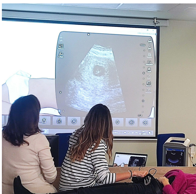
■ La formación fue práctica.