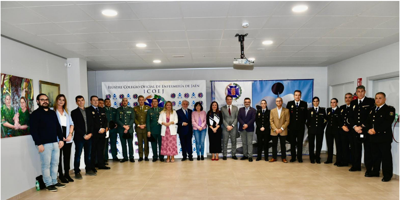
■ Ponentes, moderadores y autoridades de las II Jornadas sobre prevención de agresiones al personal sanitario.