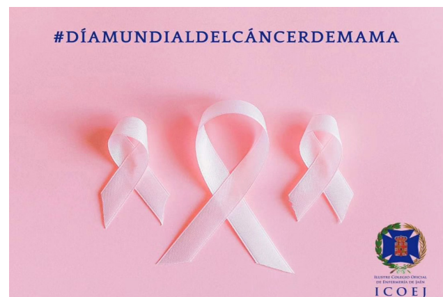
■ Cartel conmemorativo del Día del Cáncer de Mama.