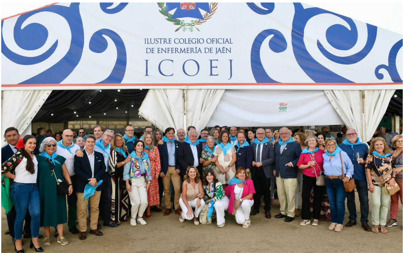
■ Una de las fotos de familia de la recepción a autoridades que tuvo lugar el lunes 16.

La Caseta del Ilustre Colegio Oficial de Enfermería de Jaén tuvo durante la Feria de San Lucas, del 11 al 22 de octubre, una amplia agenda de eventos, desde los propios del ICOEJ pasando por comidas o cenas de diferentes colectivos de la ciudad