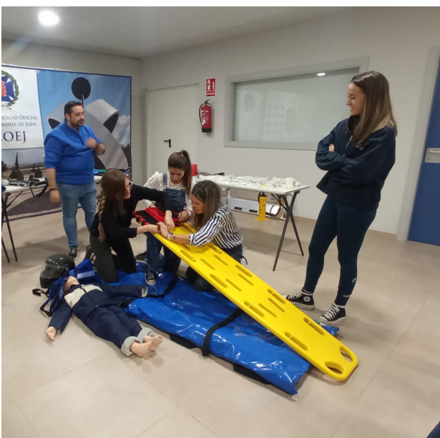
■ Durante el taller realizaron prácticas.