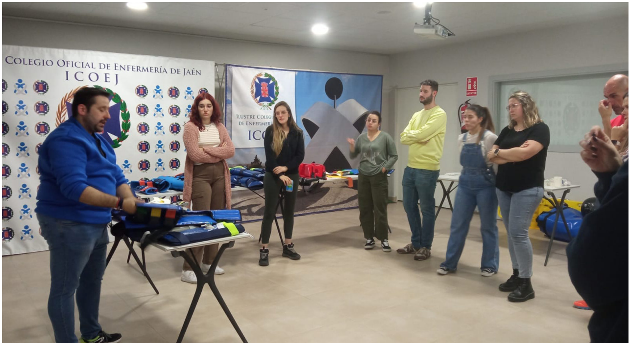
■ Una veintena de profesionales de la enfermería participaron en esta formación.

del ICOEJ. Un manejo prehospitalario del paciente traumático requiere la inmovilización y movilización adecuadas para evitar el empeoramiento de las lesiones iniciales e, impedir, la aparición de nuevos daños.