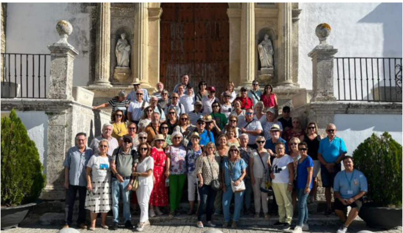
■ Un numeroso grupo de colegiados jubilados compartieron unos agradables días de convivencia entre compañeros.

En definitiva, un agradable viaje organizado por el ICOEJ para los colegiados jubilados.