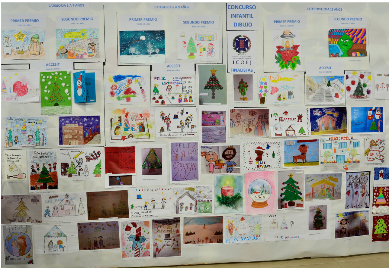
Los dibujos participantes en el II Concurso de Postales Navideñas del ICOEJ.

Además, el resto de participantes en este concurso de postales navideñas recibió un regalo por parte del Ilustre Colegio Oficial de Enfermería de Jaén.